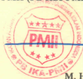
M. Hanif Dhakiri, M.Si Sekretaris Jenderal