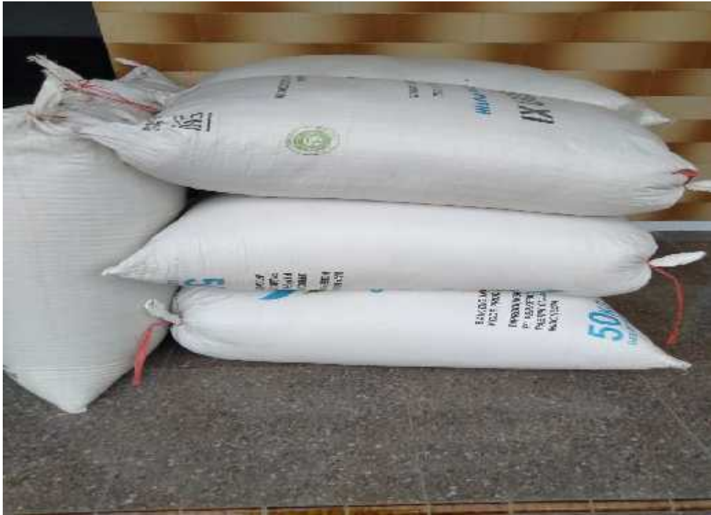
Pembayaran hutang gabah kering oleh penghutang kepada pemberi hutang