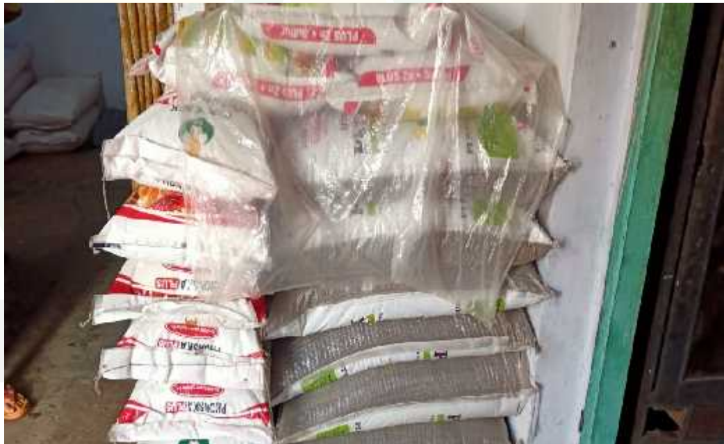
Pupuk yang akan di hutangkan kepada penghutang