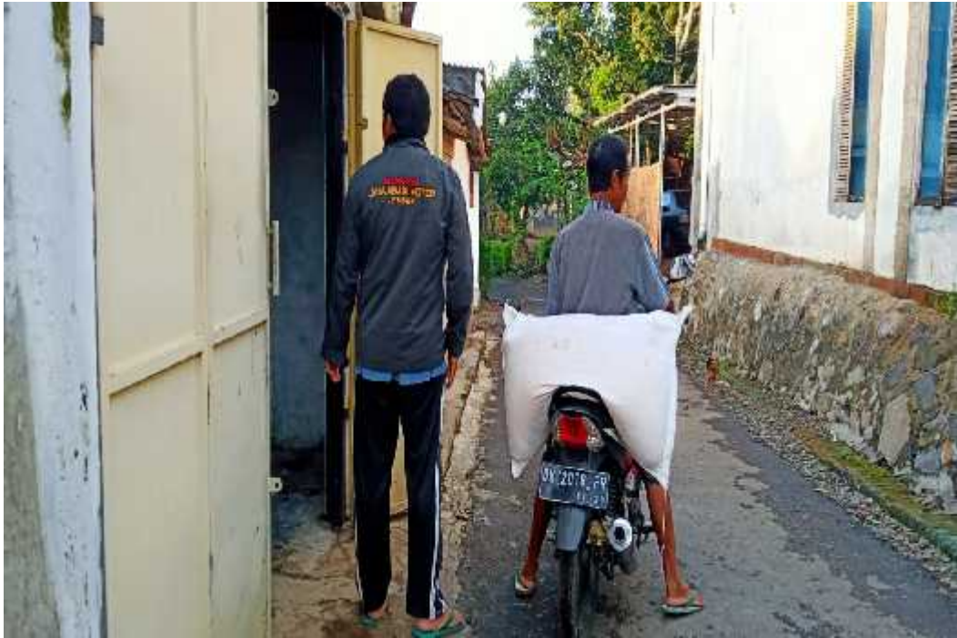
Proses pengangkutan pupuk dari pemberi hutang kepada rumah pengutang