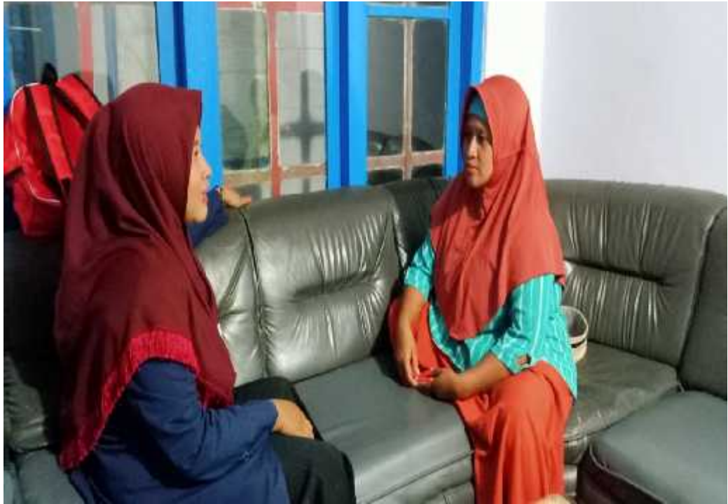
Wawancara dengan ibu Mita selaku penghutang pupuk