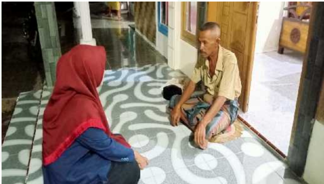
Wawancara dengan bapak No/Ripin selaku pemberi hutang pupuk