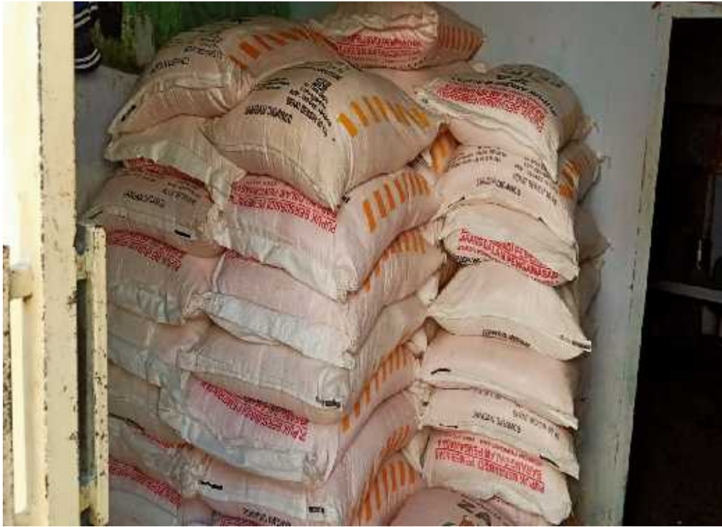
Pupuk yang akan diantar ke rumah Penghutang