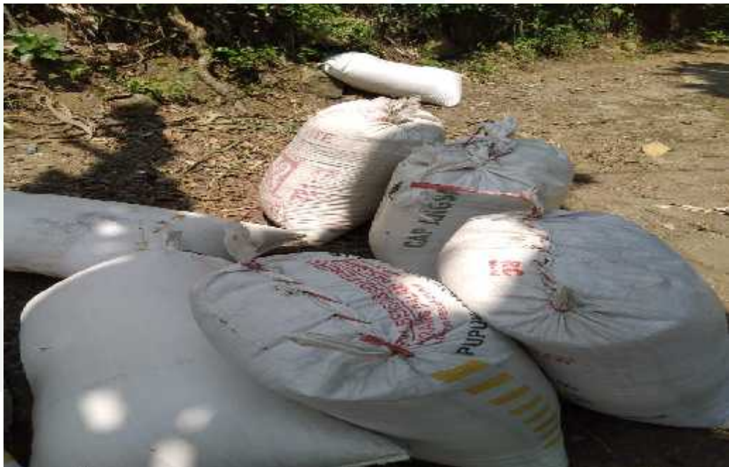
Proses pembayaran hutang dengan gabah kering oleh penghutang kepada pemberi hutang