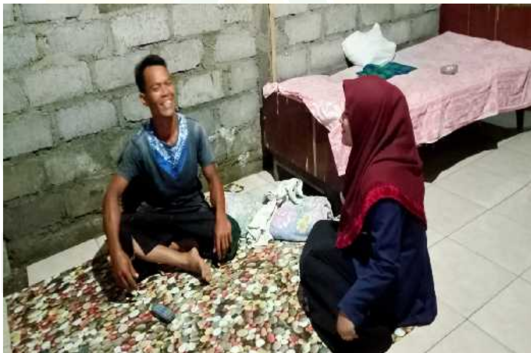
Wawancara dengan bapak Ton selaku penghutang pupuk