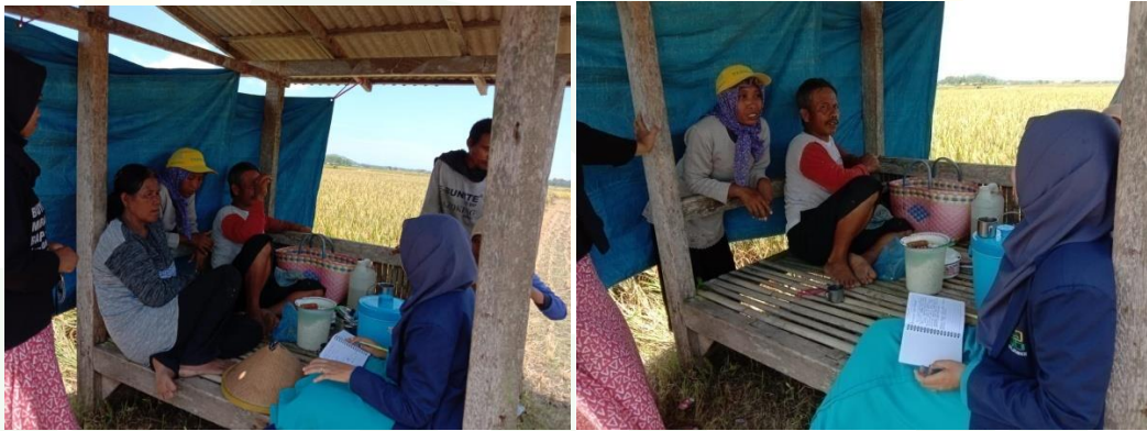
Wawancara dengan pemilik sawah dan beberapa buruh tani (penerima upah)