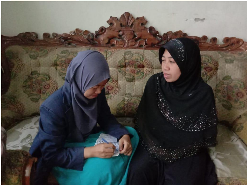
Wawancara dengan Ibu Siswanto