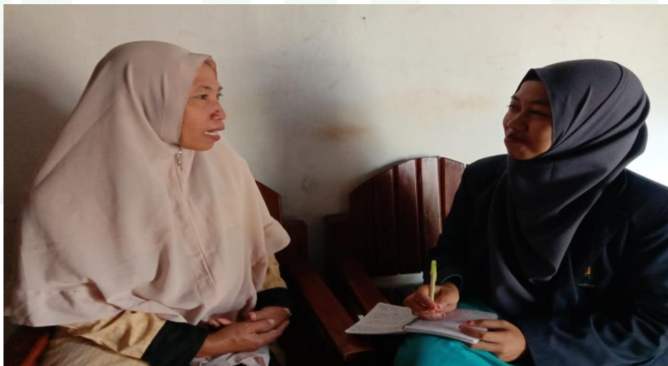
Wawancara dengan Ibu Kopsah