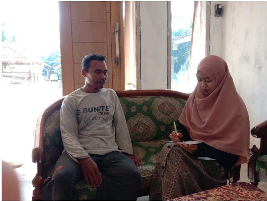
Wawancara dengan Bapak Katenno