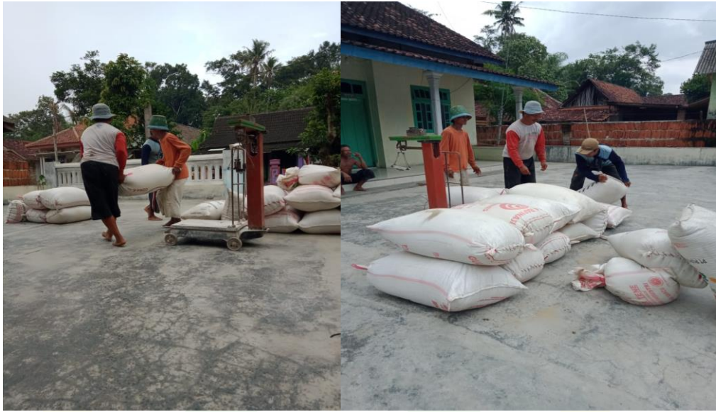
Penimbangan padi untuk pembagian upah