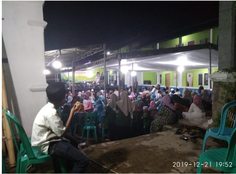
Gambar 3. Kegiatan khoul Syekh Abdul Qodir Al-Jaelani bersama masyarakat dan alumni