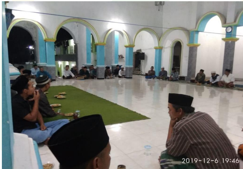
Gambar 4. Rapat persiapan khoul Syekh Abdul Qodir Al-Jaelani bersama masyarakat