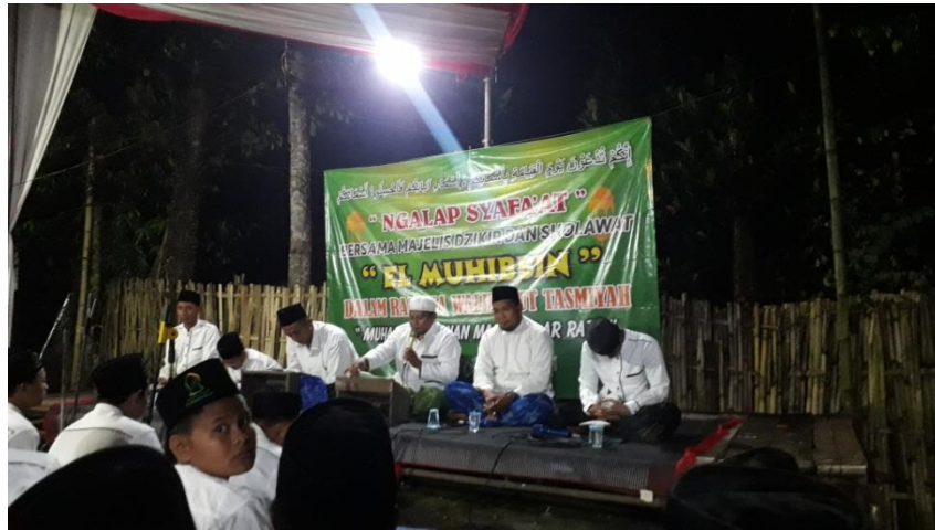
Kegiatan Majelis Dzikir Dan Sholawat El Muhibbin