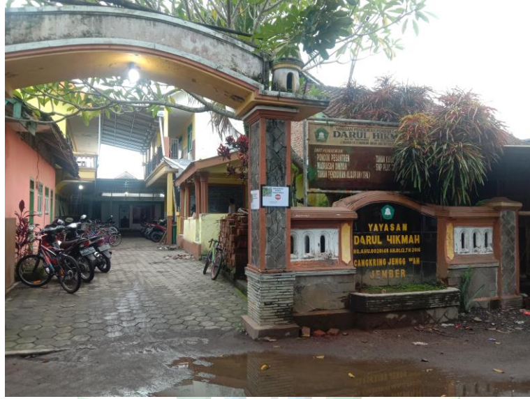
المدرسة الدينية دار الحكمة جنغاوه - جمبر