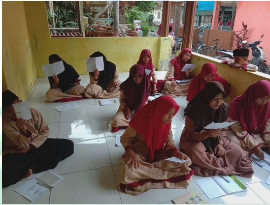
UNIVERSITAS ISLAM NEGERI