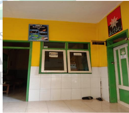
غرفة المدرس وغرفة رئيس المدرسة