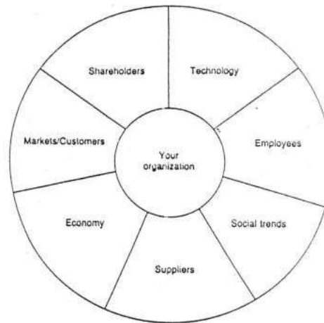
Gambar 1. Scanning the bussiness environtment

Terdapat beberapa variabel yang menjadi lingkungan dari sebuah organisasi. Variabel-variabel tersebut tidak hanya mampu mempengaruhi organisasi. Melainkan juga dapat menentukan posisi dimana letak organisasi dalam kurva pertumbuhannya. Dari gambar diatas dapat dipahami meski mengenali kemampuan, kelebihan serta kelemahan organisasi menjadi penting untuk dilakukan, akan tetapi perlu dikenali terlebih dahulu berbagai variabel seperti: ekonomi, pemasok, tren sosial, pekerja, teknologi, pemegang saham, pasar atau pelanggan kita 5 . Variabel-variabel tersebut dapat menjadi tren lingkungan yang mengarah pada perubahan yang terjadi