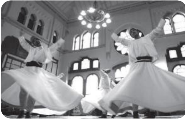
Tarian sufi Maulawiyah yang didirikan oleh murid-murid Rumi

Untuk menggambarkan lebih jauh hubungan langsung antara seni Islam dan spiritualitas, kita dapat beralih ke kasus seni pertunjukan di mana pengetahuan tentang Keesaan Ilahi dan cinta Nabi serta hampir semua aspek lain dari Spiritualitas Islam diperlakukan dalam bentuk yang sangat artistik. Pribadi dan tulisan-tulisan Jalaludin Rumi merupakan sinkretisme sempurna antara sastra Islam dan juga musik dan spiritualitas Islam. Kehidupan Rumi adalah karya seni yang hebat yang tertutup sejak awal dalam dunia spiritualitas Islam dan menghasilkan sekaligus dalam dimensi puisi, musik dan tarian sakral, dan terus memperkaya kehidupan spiritual umat Islam bahkan non Muslim hingga saat ini.