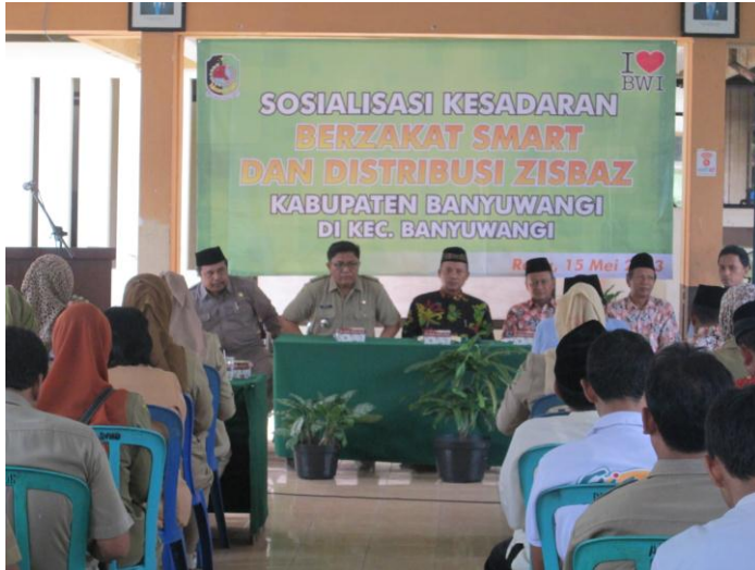
Sosialisasi Sadar Zakat di Kecamatan Banyuwangi