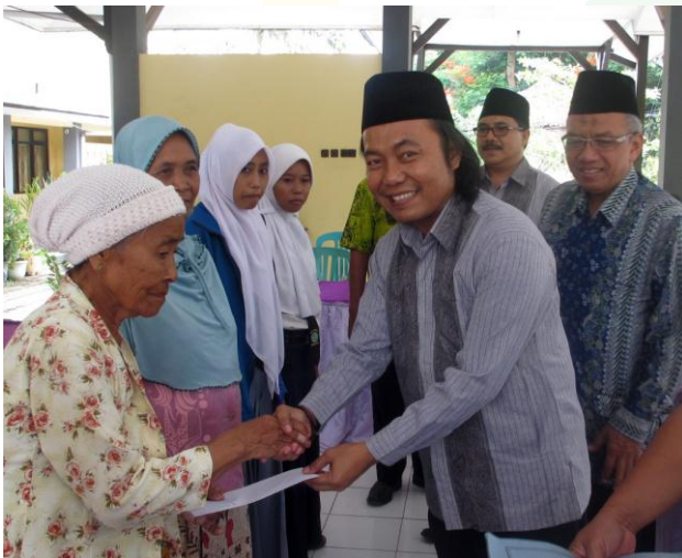
Penyerahan dana ZIS kepada mustahik