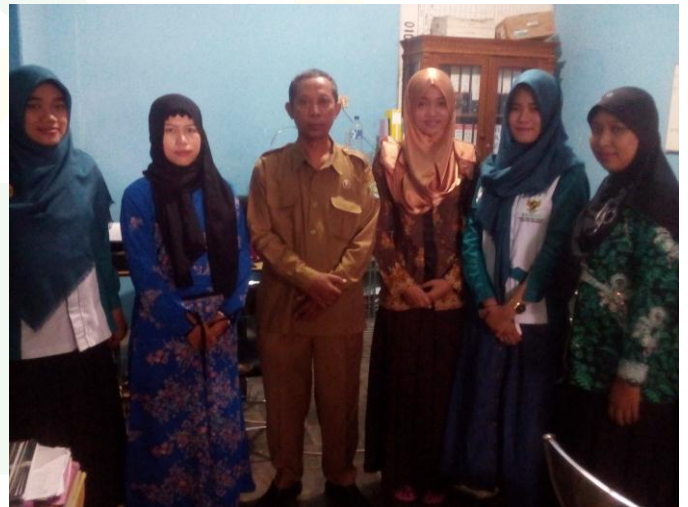
Foto Bersama Sekretariat BAZNAS Banyuwangi