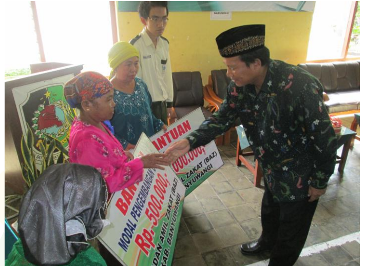
Bantuan Modal Usaha