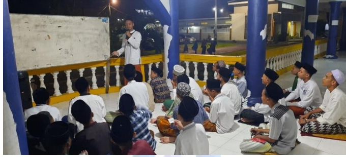
(قائمة الصور ٤.٣)

بعد الانتهاء من افتتاح وتقديم المواد والأهداف ونموذج التعليم التي سيتم استخدامها، ثم يشرح الأستاذ فوائد المواد الكلام عن المفردات حول الحيوانات ويوفر بعض الدوافع التعليمية بهدف بقاء التلاميذ متحمسين لتعليم اللغة العربية، وخاصة المهارة الكلام. ثم لا ينسى الأستاذ لدعوة التلاميذ بإدراج ترانيم عربية (yel-yel) بأولا ليكونوا متحمسين أثناء التعليم حتى النهاية.