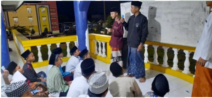
(قائمة الصور ٤.٨)

ثم طلب الأستاذ من أحد الزوجين تقديم نتائجهما، وقدم التلاميذ ردا ومدخلات حول ما إذا كانت البطاقة مناسبة أم لا.