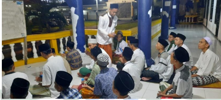
(قائمة الصور ٤.٥)

يتم منح التلاميذ الوقت لفهم الأسئلة أو الإجابة على البطاقة التي تم الاحتفاظ بها.