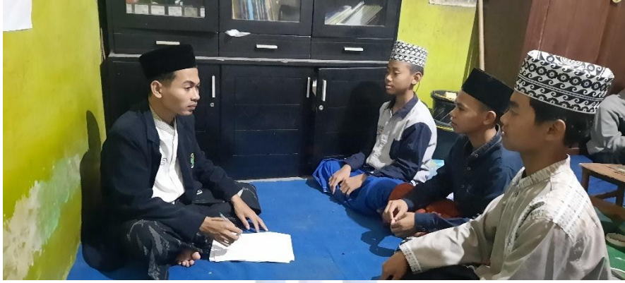
المقابلة: مع التلاميذ مركز اللغة العربية القادري