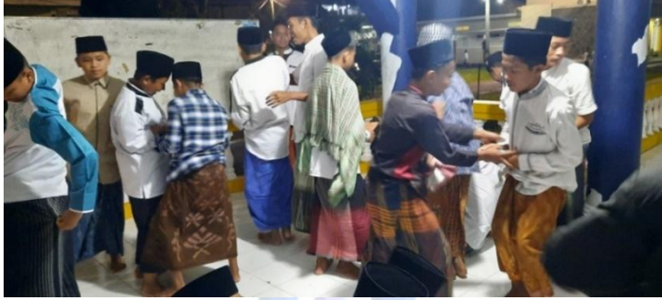
(قائمة الصور ٤.٧)

ويعاقب التلاميذ الذين لم ينجحوا في مطابقة البطاقات حتى ينفذ الوقت.