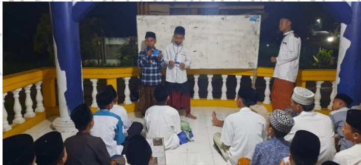
(قائمة الصور ٤.٩)