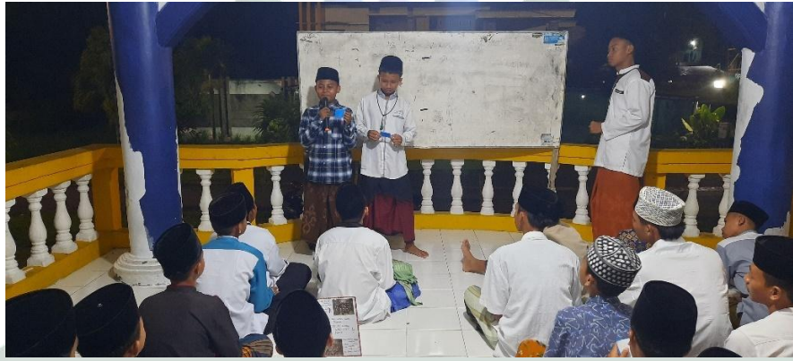
الملاحظة: فعالية تطبيق نموذج التعليم Make a Match في تعويد مهارة الكلام لدى التلاميذ في الفصل

الإبتدائي بمركز اللغة العربية معهد القادري الإسلامي الأول جember.