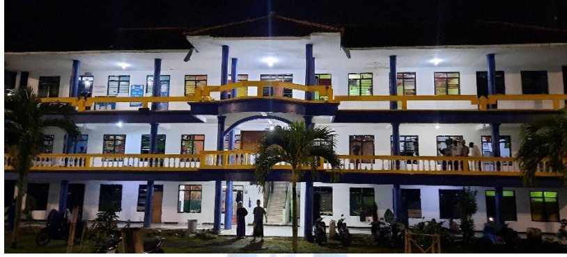
بناء مركز اللغة العربية معهد القادري الإسلامي الأول جمبر