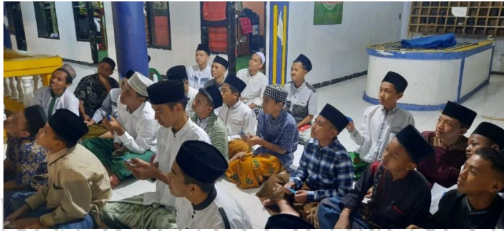
(قائمة الصور ٤.٦)

أعطى الأستاذ الوقت لتلاميذ لعثور على زوج مطابق من البطاقات بين بطاقة الأسئلة وبطاقة الإجابة.