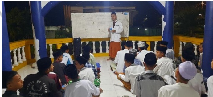
(قائمة الصور ٤.٤)

قدم أستاذ المواد التعليمية مهارة الكلام باستخدام وسائل الإعلام التي تم إعدادها قبله. المواد الموصوف تدور عن المفردات حول الحيوانات والتي تقول الأستاذ بصوت المرتفع المفردات المعنية، ثم يستمع إليها التلاميذ.