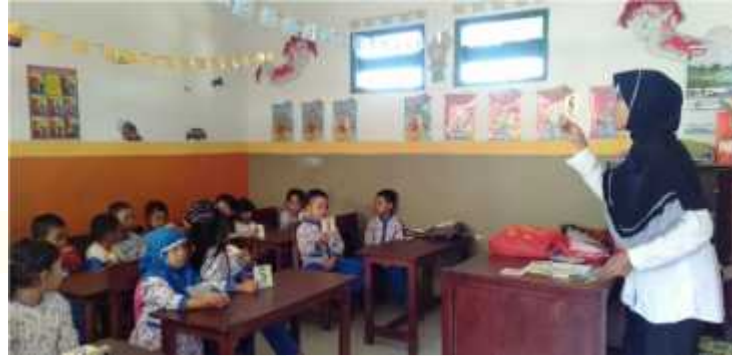
Guru menerangkan bagaimana bermain media kartu lambang bilangan