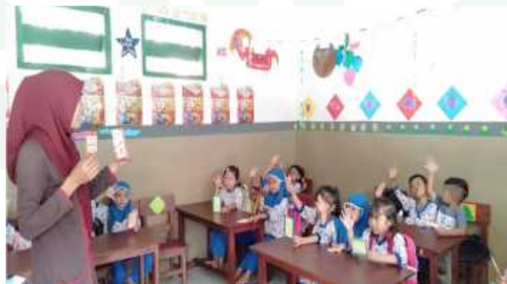
Guru memberikan kesempatan kepada anak didik untuk berani latihan memanfaatkan media kartu lambang bilangan