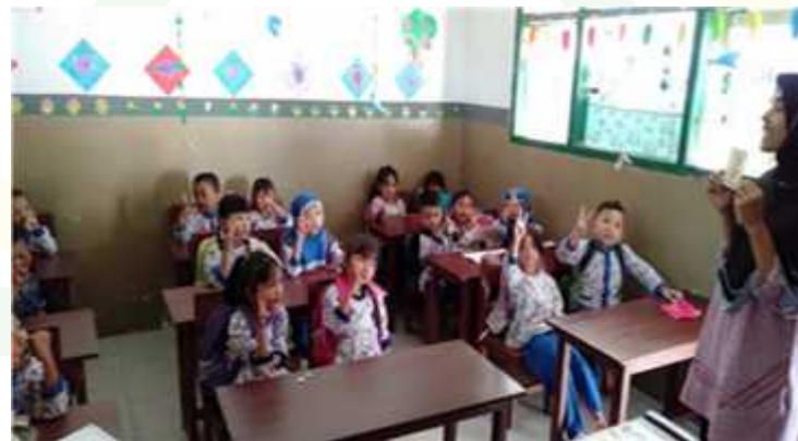
Guru memberikan evaluasi ke anak didik kelompok B tentang pemanfaatan media kartu lambang bilangan untuk meningkatkan kemampuan kognitif anak.