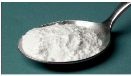
Ini akan membersihkan tubuhmu dari parasit!