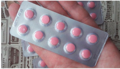
Prostat telah menyusut 3 kali lipat! Minum ini setiap malam!