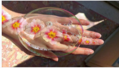
Sakit Lutut & Sendi akan Hilang jika Anda Lakukan Ini Tiap Pagi