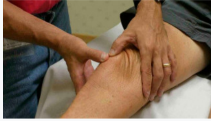
Arthritis: Cara ajaib untuk menghilangkan Sakit Lutut & Sendi