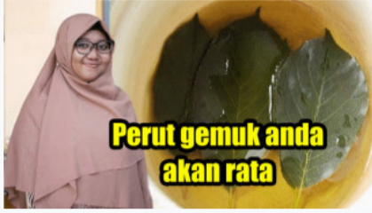
Turunkan 18 Kg dengan Konsumsi sebelum Tidur selama Seminggu