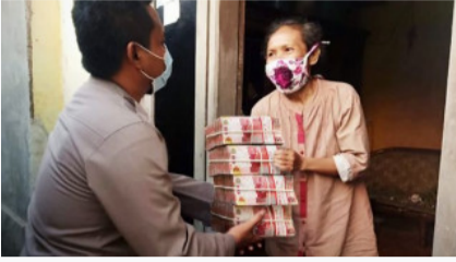
Keluarga asal Jember Kaya dalam 7 Hari setelah Baca Ini