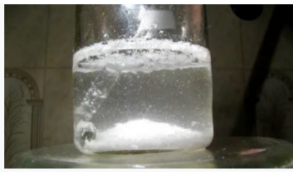
Ini akan membersihkan tubuhmu dari parasit!