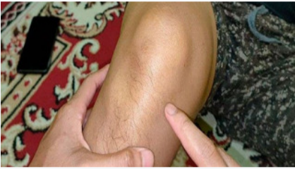
Arthritis: Cara ajaib untuk menghilangkan Sakit Lutut & Sendi