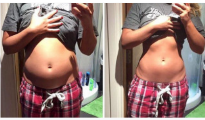
Cara Menghilangkan -17 Kg Lemak Perut dalam 2 Minggu