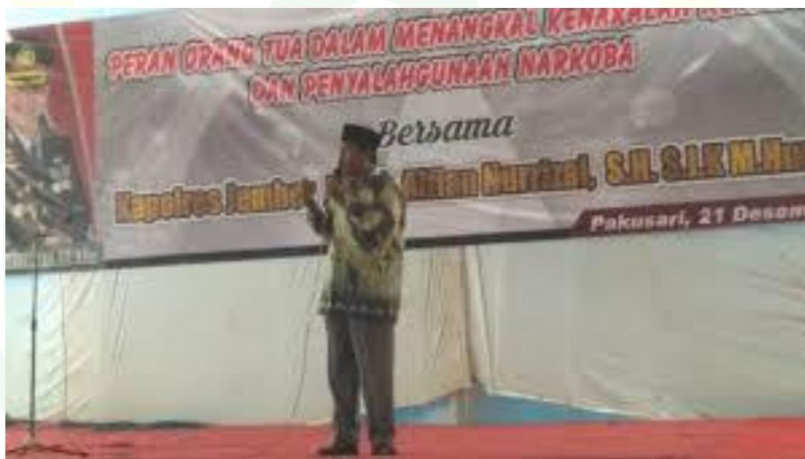
Kegiatan Penyuluhan Tentang Himbauan Bahaya Narkoba