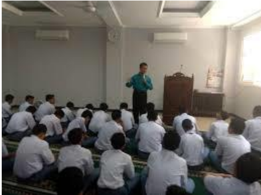
Kegiatan Sholat Dhuha