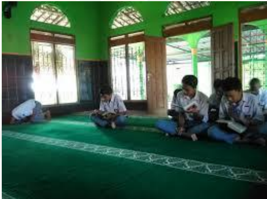
Siswa Sedang Praktek Sholat Dan Mengaji