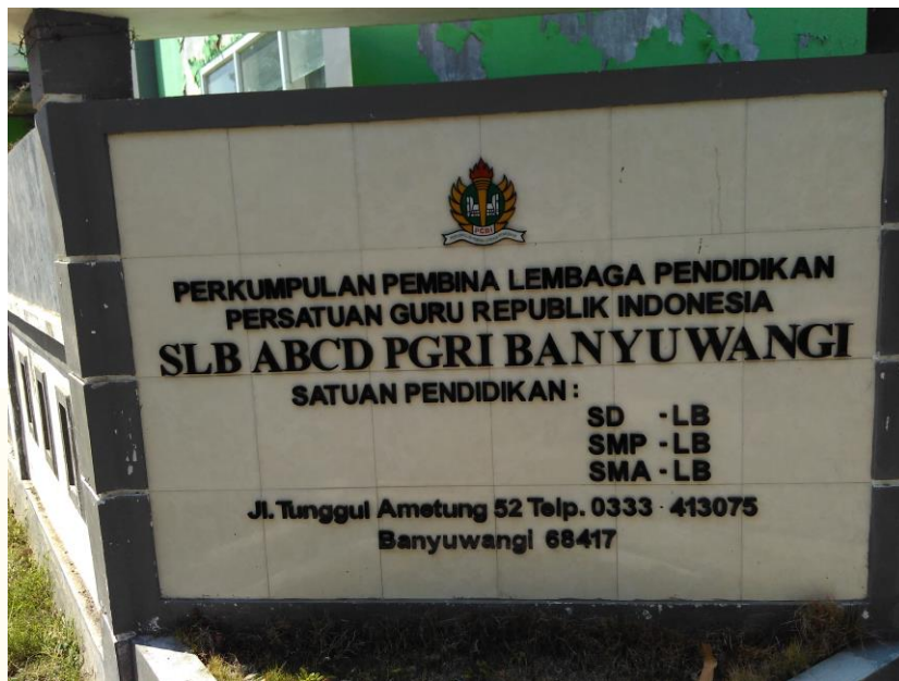
Gambar 1: Potret depan SLB ABCD PGRI Banyuwangi