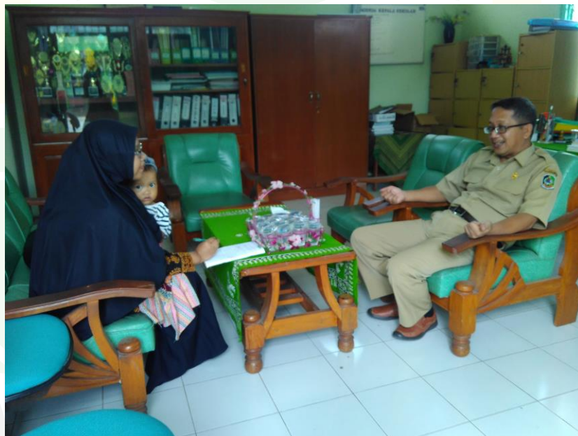
Gambar 2: Wawancara dengan kepala sekolah SLB ABCD PGRI Banyuwangi