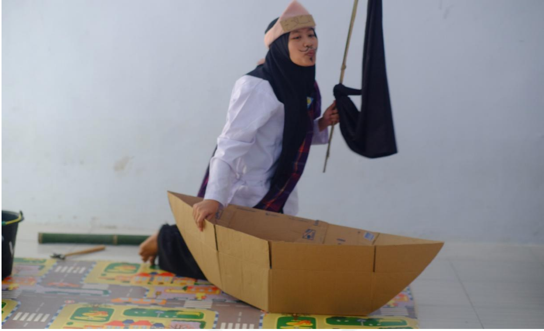
جمبر، ٢٨ يناير ٢٠٢٣ (٠٩:٠٠) ملاحظة عن تعليم مهارة الكلام بطريقة تقديم القصة بالمدرسة الإصلاح المتوسطة الإسلامية جنجاوة