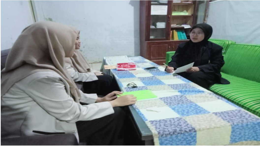
جنبر، ١ فبراير ٢٠٢٣ (٣٠:٠٩) مقابلة شخصية مع بعض التلاميذ بالمدرسة الإصلاح المتوسطة الإسلامية جنجاوة