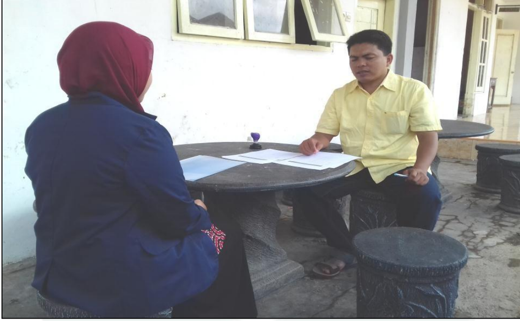
جنبر، ٢٨ يناير ٢٠٢٣ (١٥:١٠) ملاحضة الشخصية التي قامت الباحثة مع مدرس اللغة العربية بمدرسة الإصلاح المتوسطة الإسلامية جنجاوة.