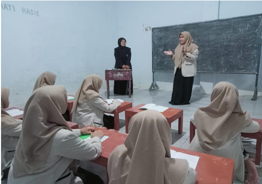
جمبر، ١ فبراير ٢٠٢٣ (٠٧:٠٠) ملاحظة عن تعليم مهارة الكلام بطريقة تقديم القصة في فصل السابع بالمدرسة الطغصلاح المتوسطة الإسلامية جنجاوة.