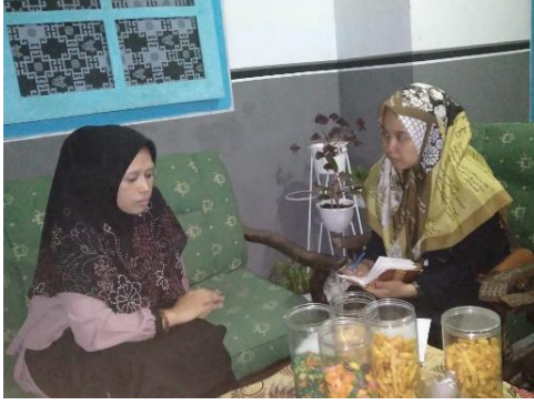
المقابلة الشخصية مع المعلمة الأخرى (الوثائقية: ٩ يونيو ٢٠٢٣)