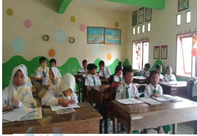
يفعل المستجيبين على الإستبيان

على الطلاب. و عند العمل على الاستبيان الذي قدمه الطلاب، كانوا سعداء لملئه. ٥٩