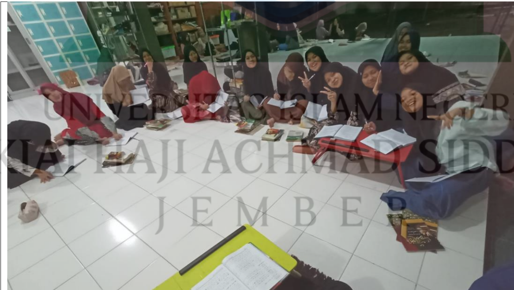
الصورة الثانية : عملية طريقة البداية في المعهد