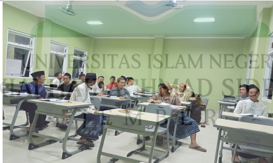
الصورة الرابعة : عملية طريقة البداية في المعهد