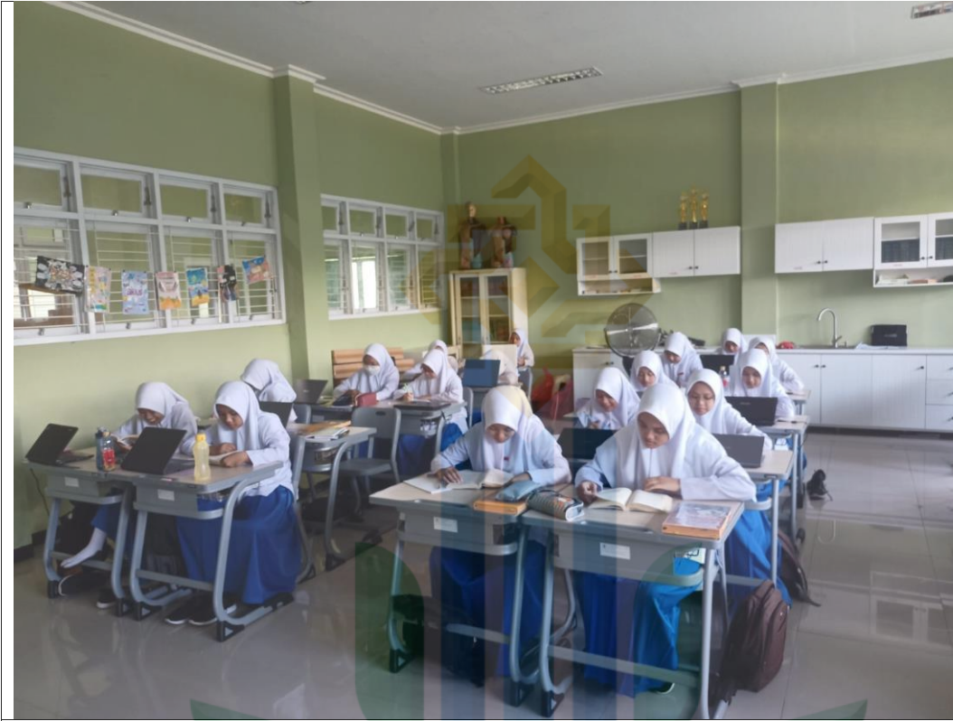
الصورة الأولى : عملية تطبيق طريقة البداية في المدرسة