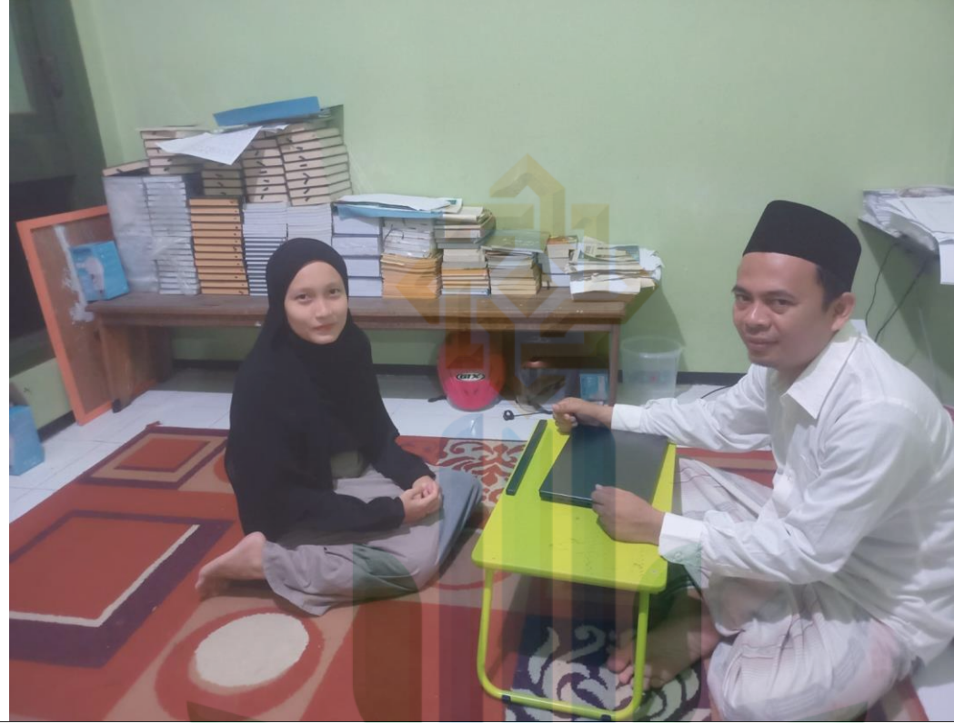
الصورة الثالثة : المقابلة الشخصية مع أحد الأساتذ