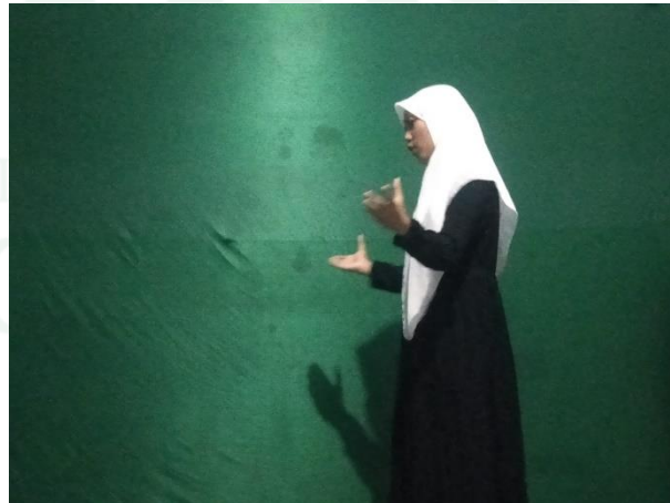
الملاحظة نشاط اللغة العربية اللاصفي في مركز ترقية اللغة الأجنبية