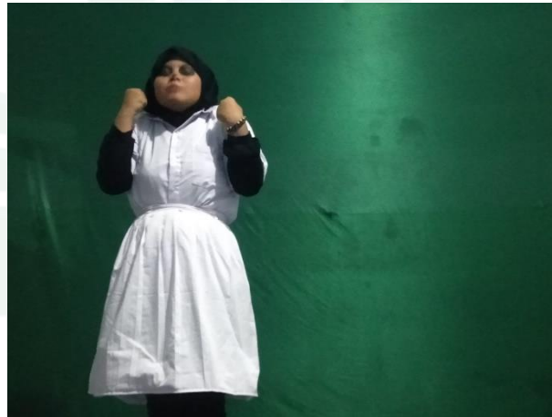
الملاحظة نشاط اللغة العربية اللاصفي في مركز ترقية اللغة الأجنبية