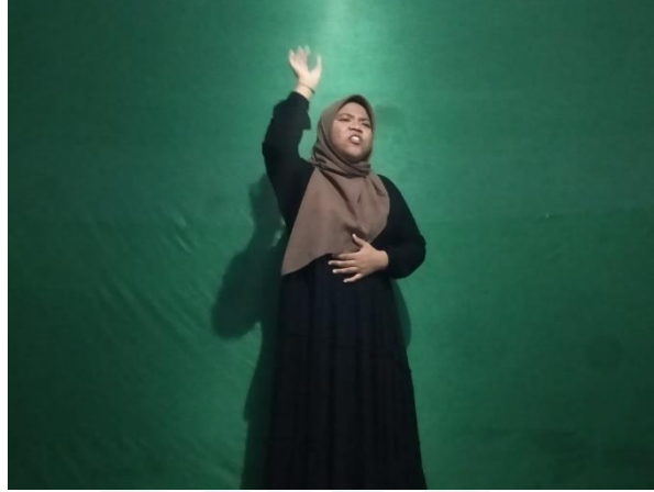
الملاحظة نشاط اللغة العربية اللاصفي في مركز ترقية اللغة الأجنبية