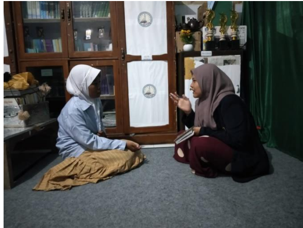
المقابلة الشخصية مع مرحلة العليا