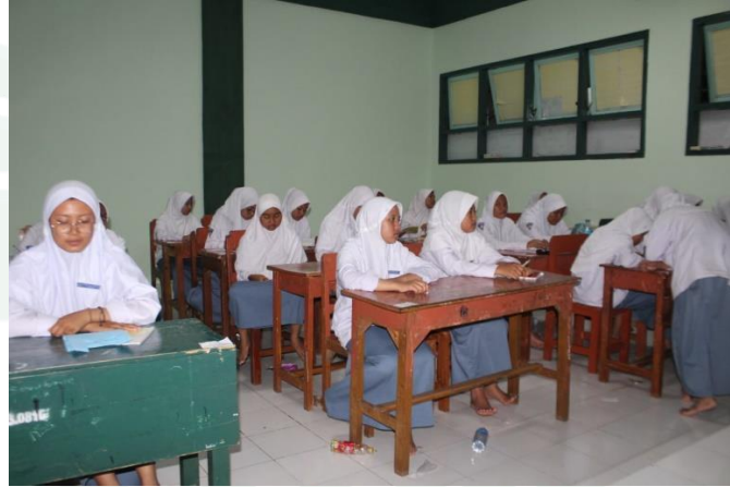
الملاحظة نشاط الدورة في مبنى المدرسة الثانوية نور الجديد