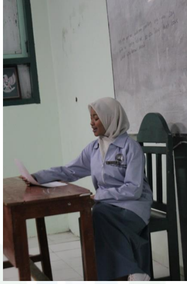
الملاحظة نشاط اللغة العربية اللاصفي في مركز ترقية اللغة الأجنبية