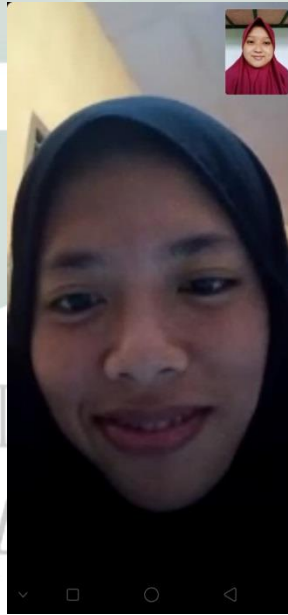
ليل يتس ري فردوس