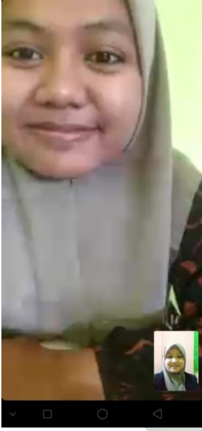
نور الليلة القبطية