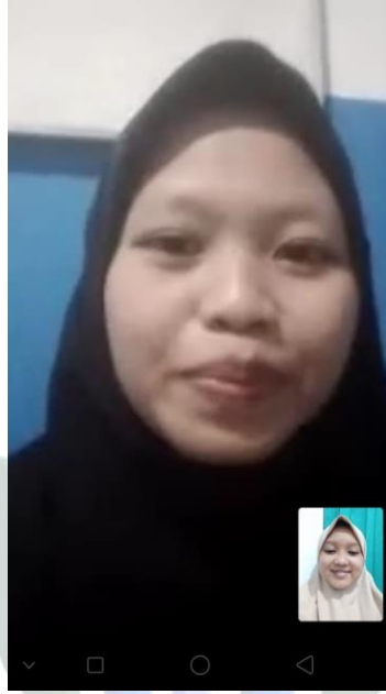
فريسكى سلفية الجنة