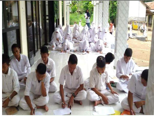
نعطى الباحثة الاستفتاء إلى التلاميذ البعدي