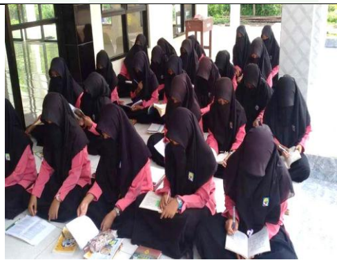
تعطى الباحثة الاختبار إلى التلاميذ البعدي