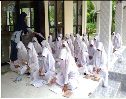
نعطى الباحثة الاستفتاء إلى التلاميذ القبلي