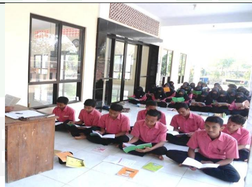
تعطى الباحثة الاختبار إلى التلاميذ القبلي