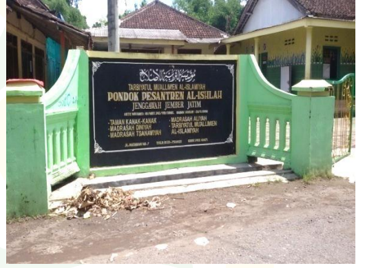
الفصل المدرسة الثانوية بمعهد الإصلاح جنجاواه جمبر