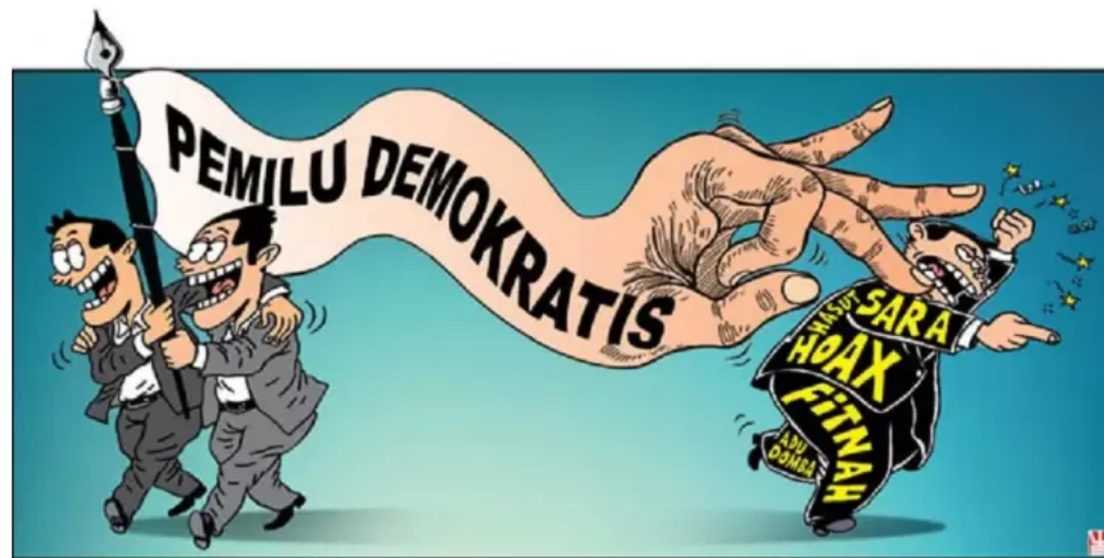
Pemilu serentak menjadi kesempatan bagi masyarakat Indonesia untuk memilih pemimpin dan wakil yang dianggap kompeten dalam mengemban tugas.