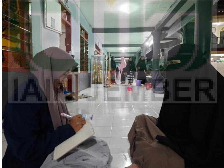
مقابلة الشخصية مع أنري الطلابة الصف الثالث