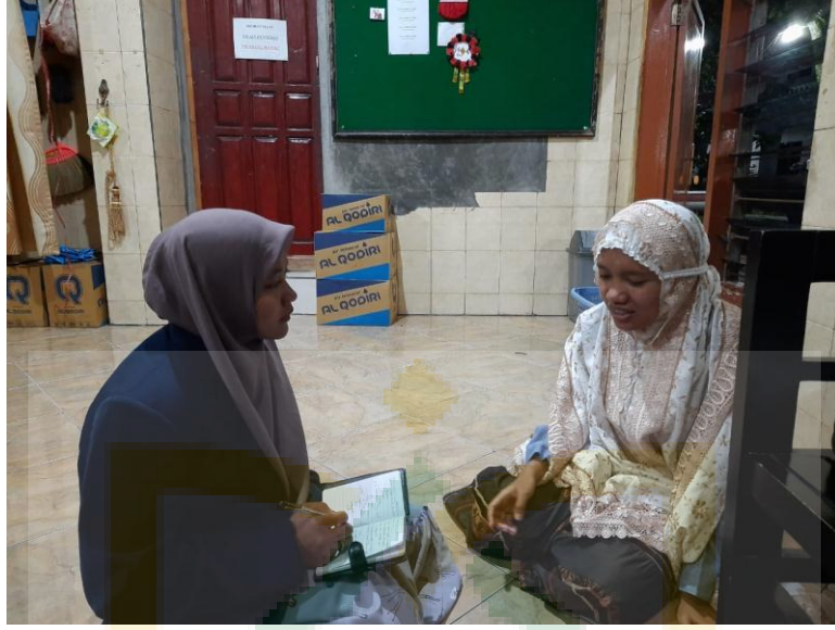
مقابلة الشخصية مع ستي ألفتية الجنتة تحفة العربية