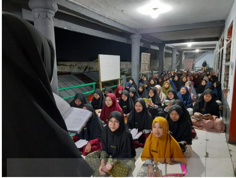
أنشطة عملية تعليم المفردات اللغة العربية