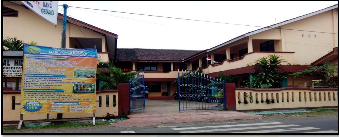
الصورة ١. الوثائقية في التاريخ ١٨ يوليو ٢٠١٦ بنیان المدرسة الهداية المتوسطة الإسلامية منجلي جمبر