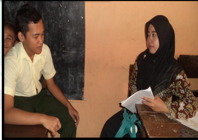
الصورة ٥. في التاريخ ٠٤ أغسطس ٢٠١٦ المقابلة الشخصية مع بعض التلاميذ