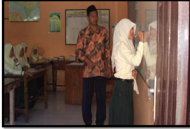
الصورة ٥. في التاريخ ١٠ أغسطس ٢٠١٦ التقويم التعليمي