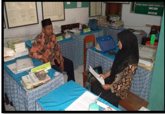
الصورة ٣. في التاريخ ٢٠ يوليو ٢٠١٦ المقابلة الشخصية مع مدرس اللغة العربية