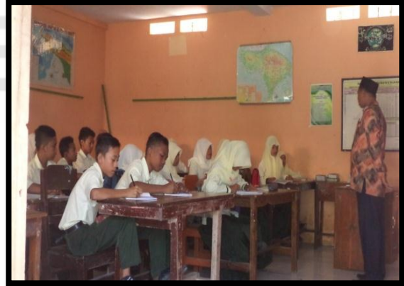
الصورة ٤. في التاريخ ٢٧ يوليو ٢٠١٦ عملية التعليم والتعلم