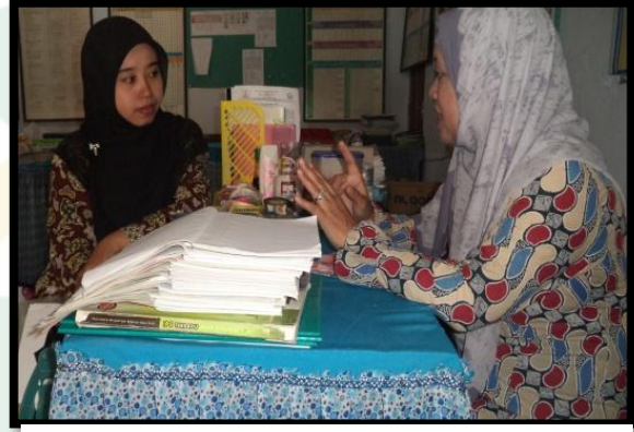
الصورة ٢. في التاريخ ٢٦ يوليو ٢٠١٦ المقابلة الشخصية مع رئيس المدرسة