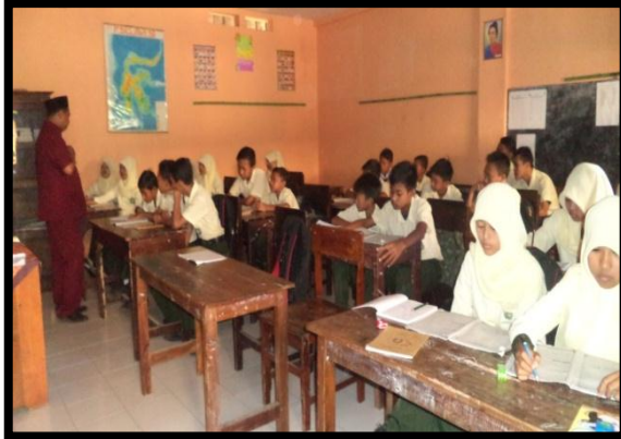
الصورة ٥. في التاريخ ١٠ أغسطس ٢٠١٦ استخدام الغناء في تعليم اللغة العربية