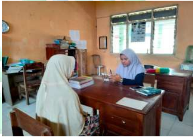
المقابلة الشخصية مع أستاذة قسم التعليم