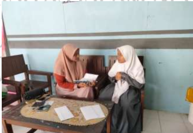
المقابلة الشخصية مع لجنة قسم التعليم