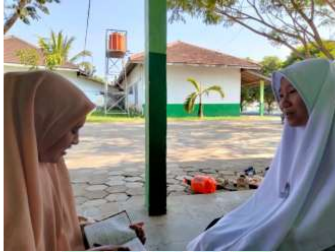
المقابلة الشخصية مع بعض الطالبات