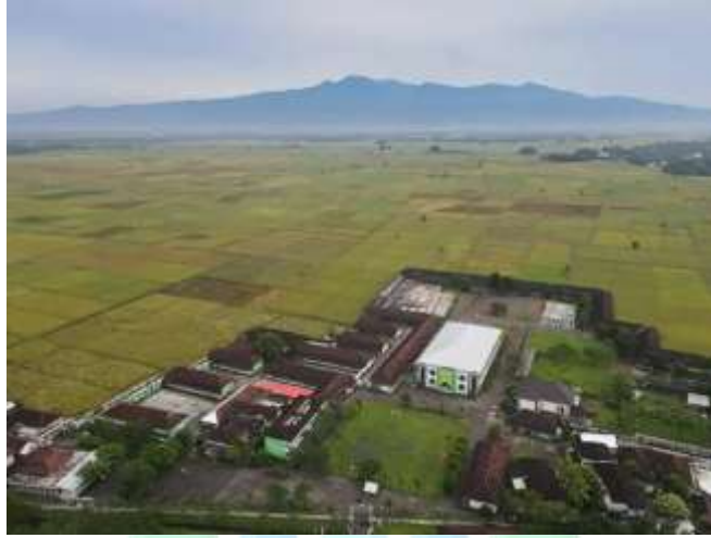
معهد بيت الأرقم للتربية الإسلامية بالونج جمبر