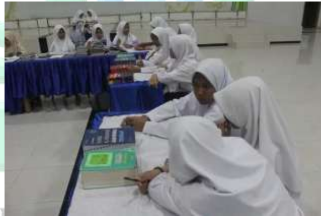
عملية أنشطة مسابقات بين الفصول يعني مسابقات المناظرة اللغوية