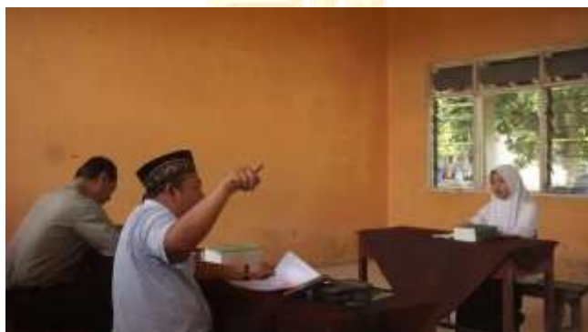
الإمتحان الشفهي لتدريب مهارة الكلام