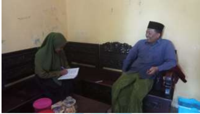
المقابلة الشخصية مع مدير المعهد بيت الأرقم للتربية الإسلامية بالونج