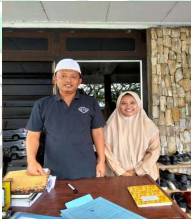
تسليم الرسالة البحث العلمي إلى مدير المعهد بيت الأرقم للتربية الإسلامية بالونج