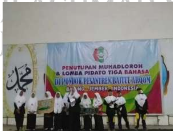
مسابقة تمثيلية بثلاث لغات