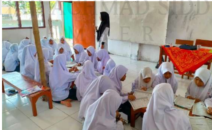
أنشطة التعليم مهارة القراءة من خلال المعلمين الأقران