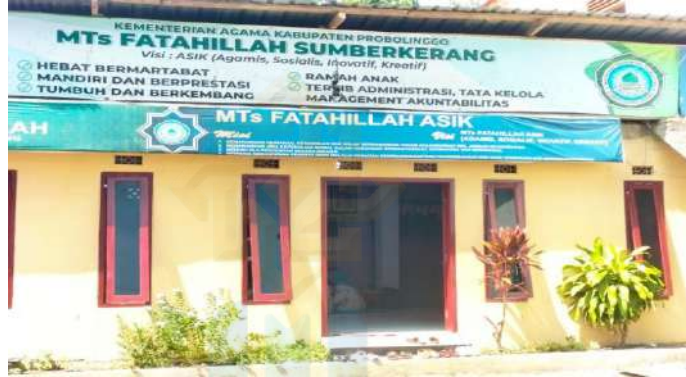
ساحة المدرسة المتوسطة الإسلامية فتاح الله سومبركرانج كندينج فروبولينجو