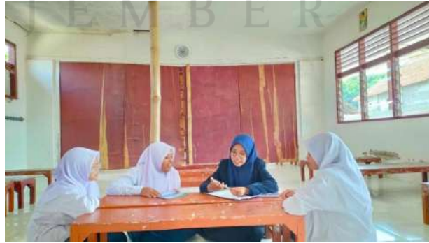
المقابلة الشخصية مع الطالبة