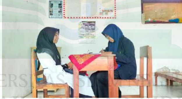
المقابلة الشخصية مع الأستاذة عين الرحمة (معلم اللغة العربية)