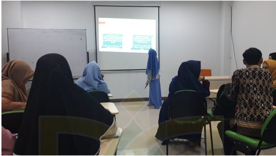
الملاحظة في فصل "ب" الثالث