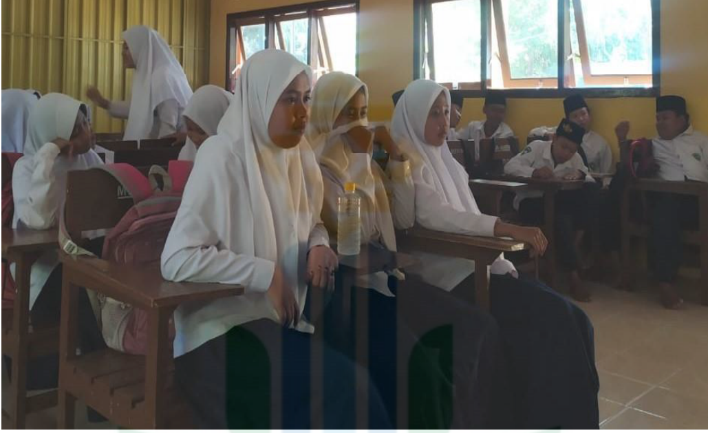
الصورة ١.٨ صورة جماعة 8