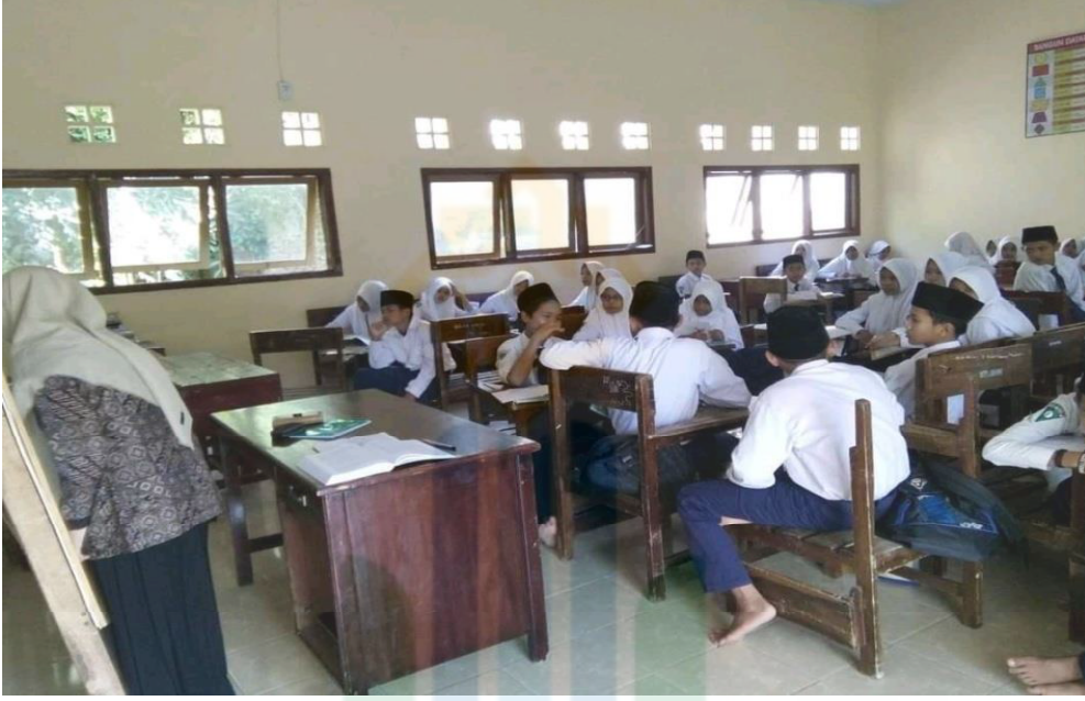
الصورة ١.٤ الجو أثناء عملية التعلم فى الصف الثامن 4