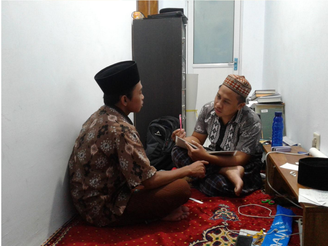
القبالة الشخصية مع أستاذ ناصح فؤادي