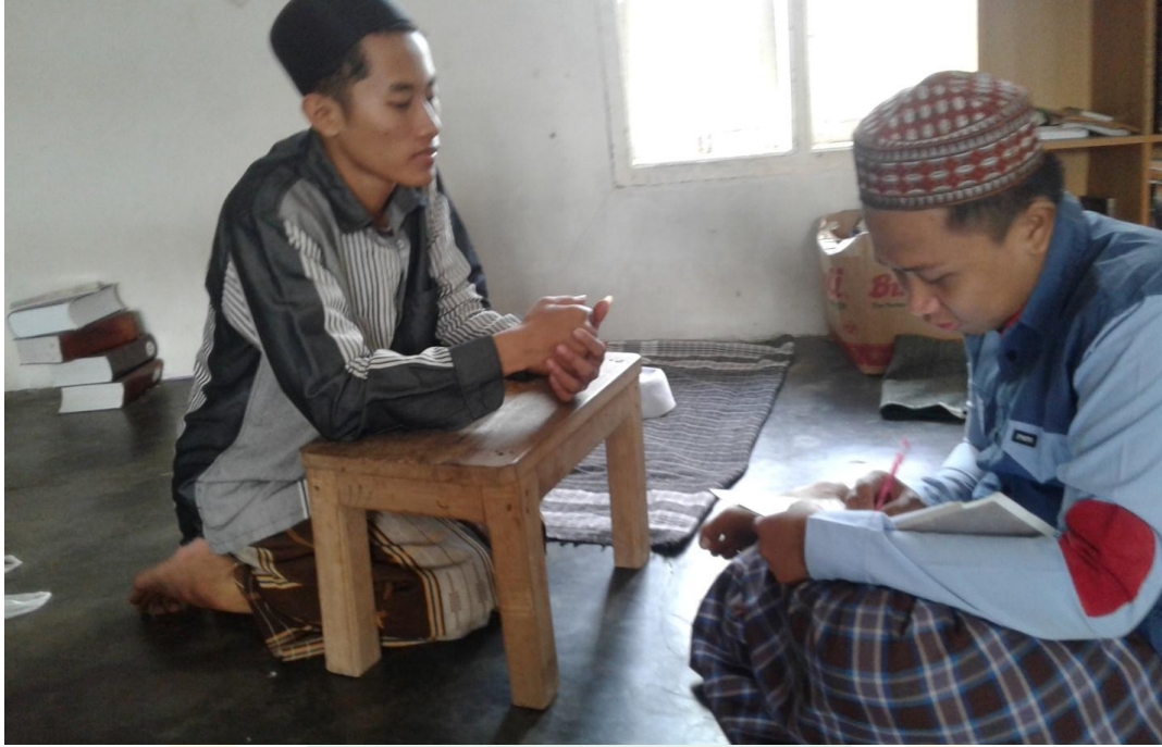
القبالة الشخصية مع أستاذ رئيس الإخوان