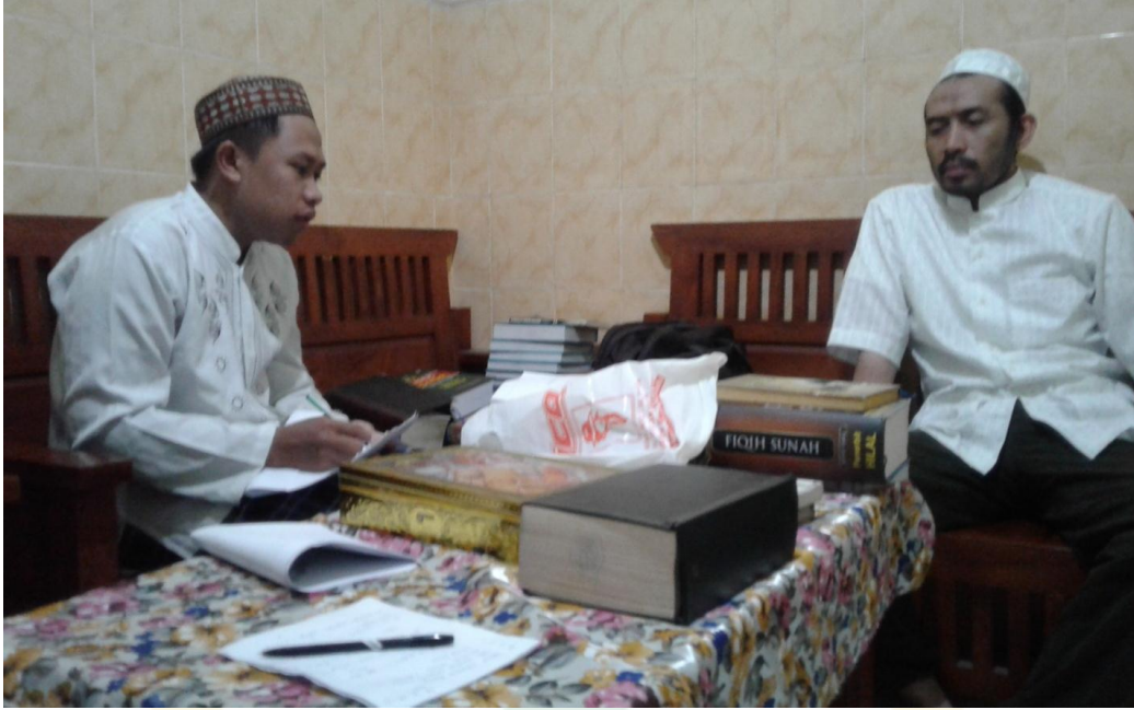
القابلة الشخصية مع مؤسس المعهد البداية