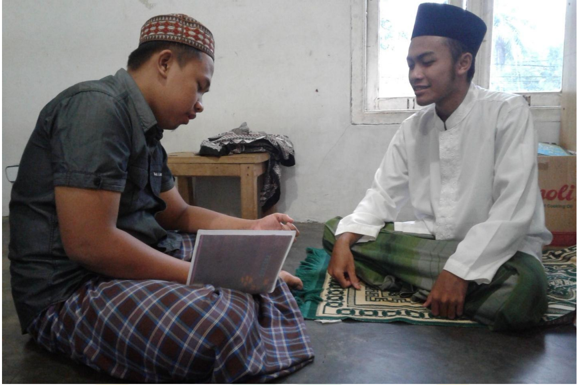
القابلة الشخصية مع بعض الطلاب