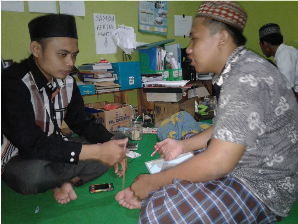
القابلة الشخصية مع رئيس المعهد البداية