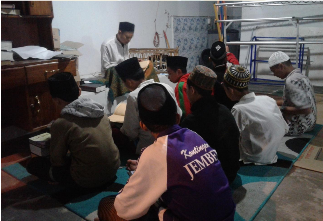
تطبيق هذه الطريقة الإضافية