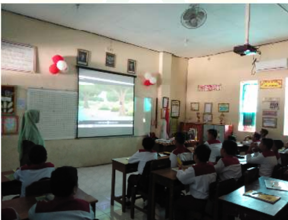
تنفيذ وسائل السمعية بصرية بالفيلم كرتون العربي