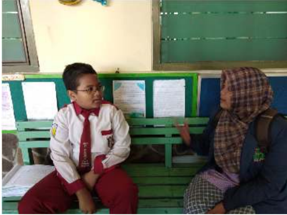
المقابلة شخصية مع التلاميذ المدرسة الابتدائية الفرقان جمبر