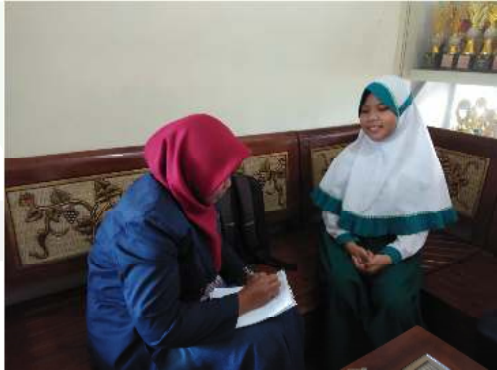
المقابلة شخصية مع التلاميذ المدرسة الابتدائية الفرقان جمبر