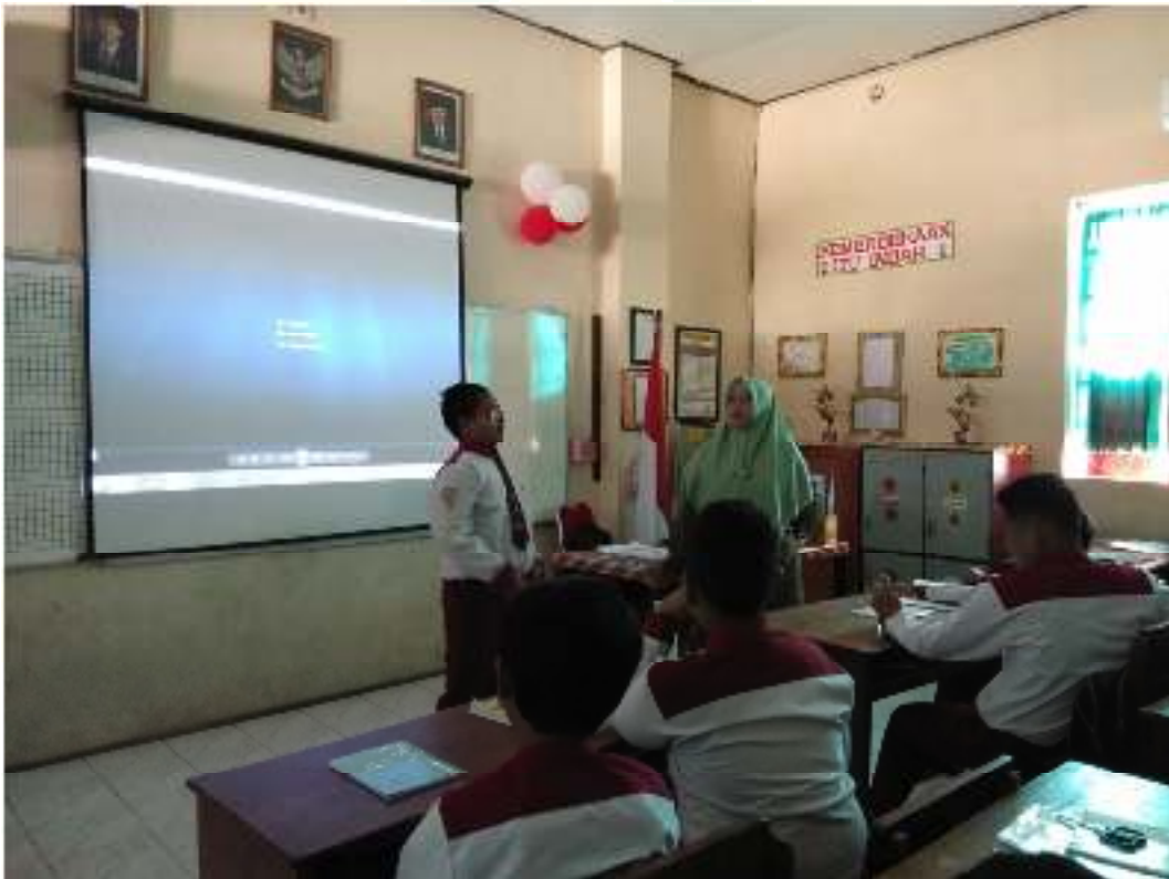
الدرس اللغة العربية في تعليم مهارة الكلام