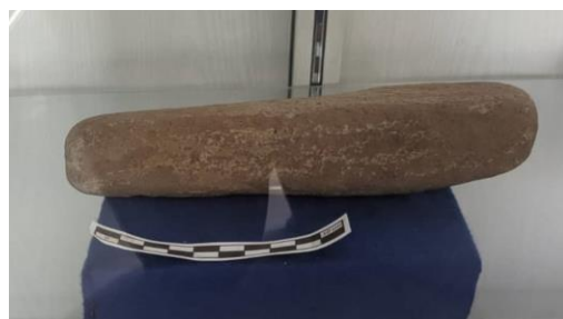
Gambar 1.6 Alat Pemukul Kulit Kayu