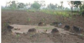
Susunan Batu Kenong