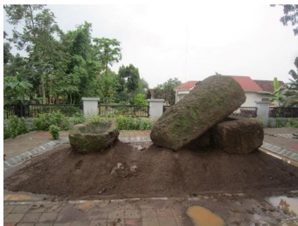
Gambar: Penyusunan Benda-Benda Purbakala di Pusat Informasi Megalitikum Bondowoso