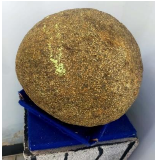
Gambar 1.4 Bola Batu