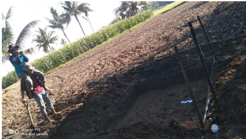
Gambar: Kajian Arkeologis Sebelum Pembangunan Pusat Informasi Megalitikum Bondowoso