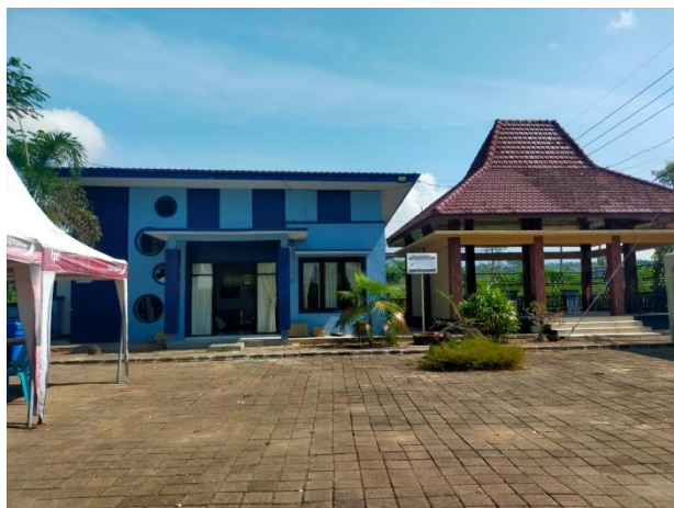
Gambar: Gedung Sebaguna dan Paseban Pusat Informasi Megalitikum Bondowoso