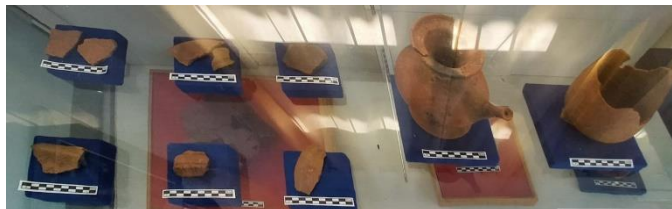
Gambar 1.12 Gerabah