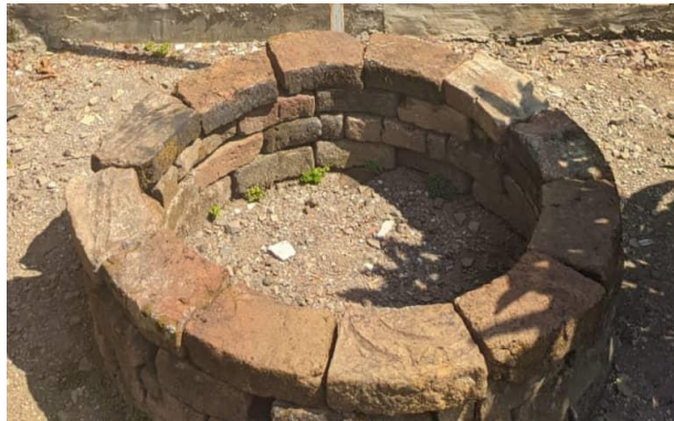
Gambar 1.21 Sumur Majapahit