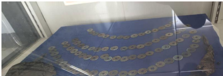
Gambar 1.14 Mata Uang Kepeng