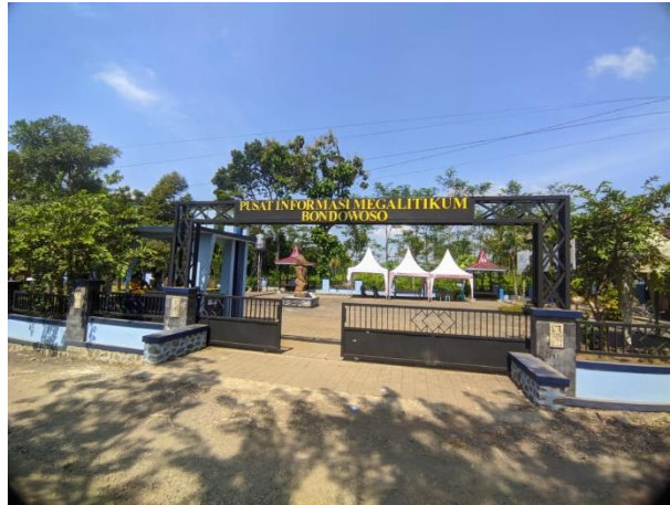
Gambar: Tampak Depan Pusat Informasi Megalitikum Bondowoso