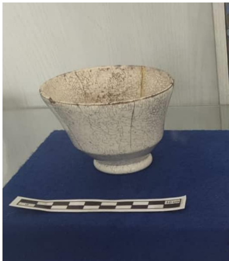
Gambar 1.13 Keramik