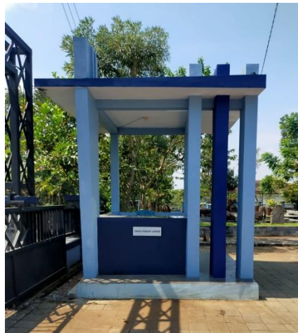
Gambar: Pos Jaga Pusat Informasi Megalitikum Bondowoso