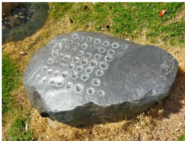
Gambar 1.19 Batu Dakon