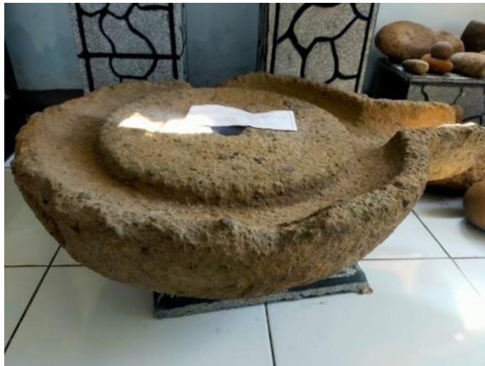
Gambar 1.9 Gilingan/Gilisan