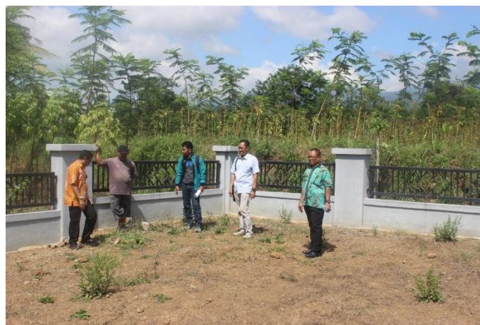
Gambar: Pengukuran dan Perencanaan Pembangunan Pusat Informasi Megalitikum Bondowoso