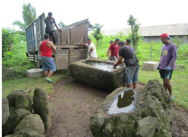
Gambar: Pemindahan Benda-Benda Purbakala ke Pusat Informasi Megalitikum Bondowoso