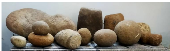
Gambar 1.3 Phalus