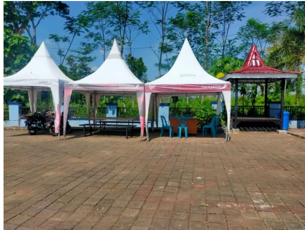
Gambar: Tempat Parkir dan Gasebo