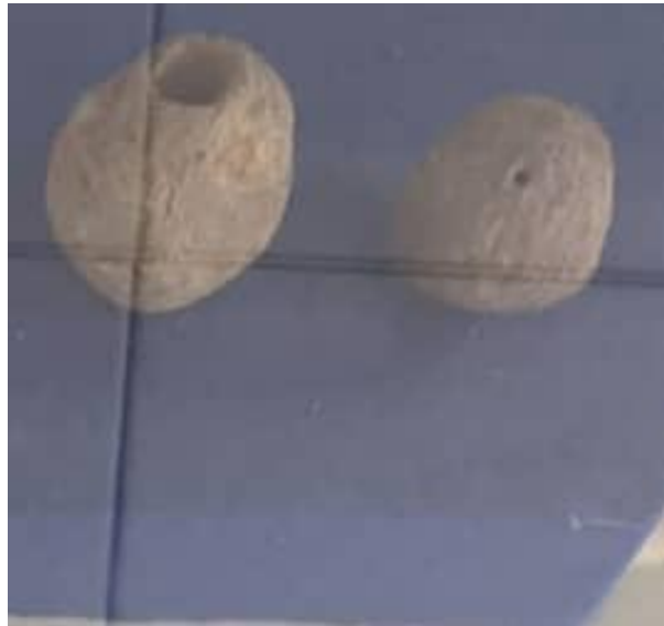
Gambar 1.10 Botol Wadah Obat