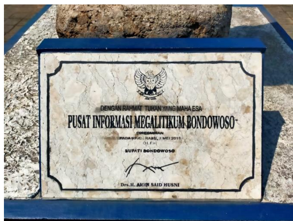
Gambar: Peresmian Pusat Informasi Megalitikum Bondowoso