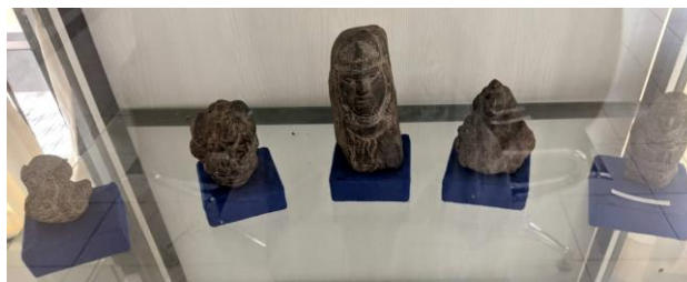
Gambar 1.2 Arca Megalit