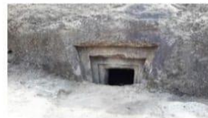
Bilik kubur batu