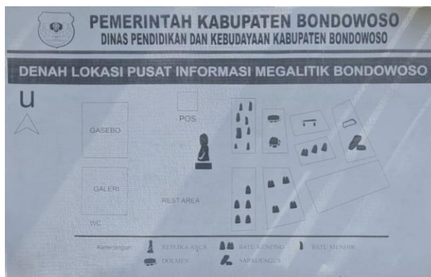
Gambar 1.1 Denah Lokasi