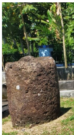
Gambar 1.20 Batu Pandhusa