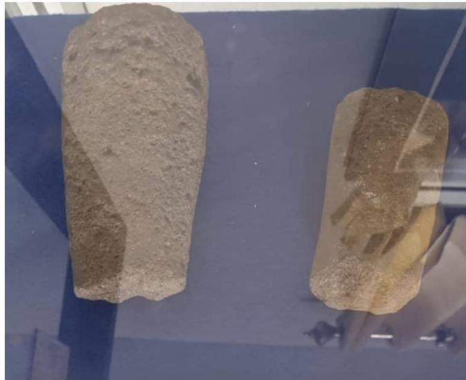
Gambar 1.7 Alat Pemecah Biji