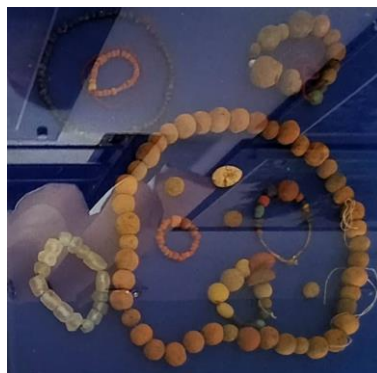
Gambar 1.11 Manik-Manik