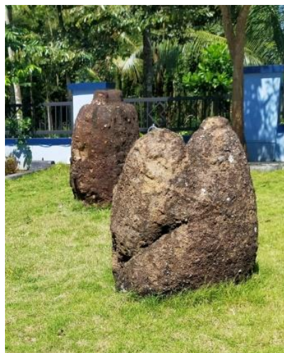
Gambar 1.15 Batu Kenong