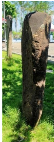
Gambar 1.16 Menhir