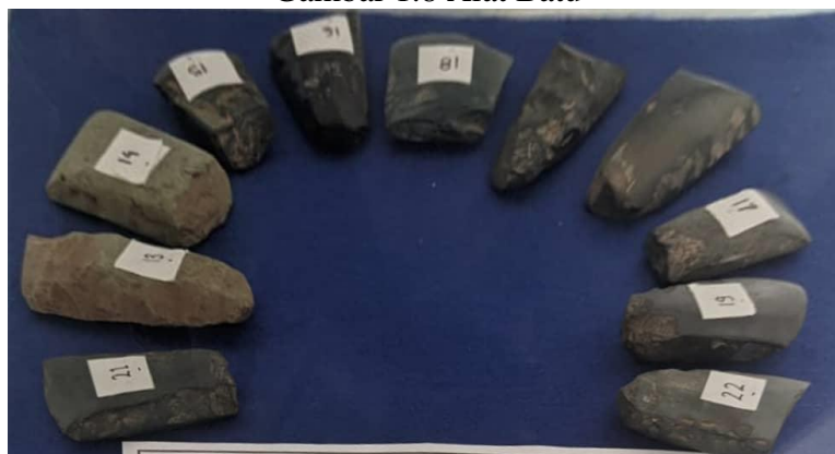
Gambar 1.8 Alat Batu