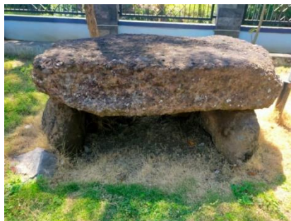
Gambar 1.17 Batu Dolmen