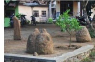
Menhir dan batu kenong di halaman rumah penduduk