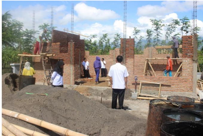
Gambar: Pembangunan Gedung Serbaguna Pusat Informasi Megalitikum Bondowoso