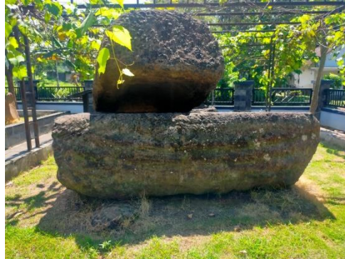
Gambar 1.18 Batu Sarkofagus