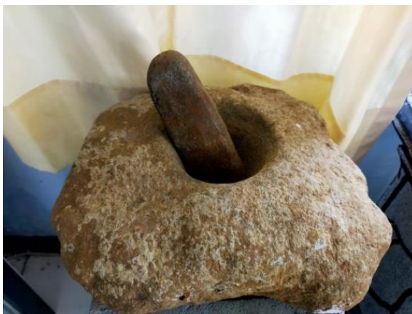
Gambar 1.5 Lumpang Batu