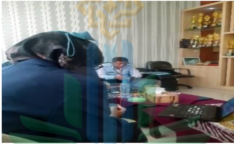
تسليم الرسالة البحث العلمي إلى مدير المدرسة المتوسطة الحكومية الاولى باسورون