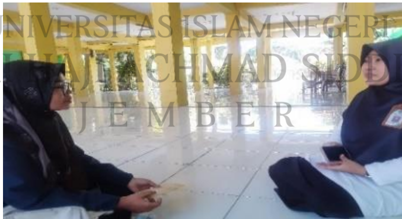
المقابلة الشخصية مع مدرسة تعليم المدرسة المتوسطة الحكومية الاولى باسورون