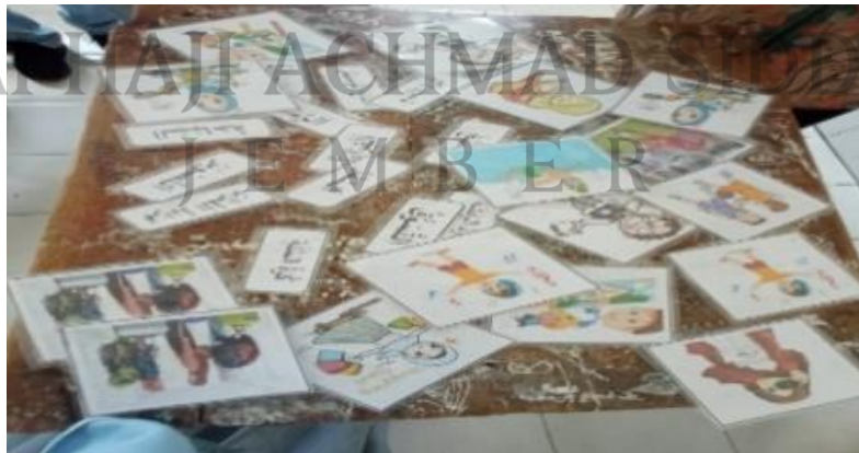
أدوات التعلم تخمين الصورة في فصل السابع المدرسة المتوسطة الحكومية الاولى باسورون