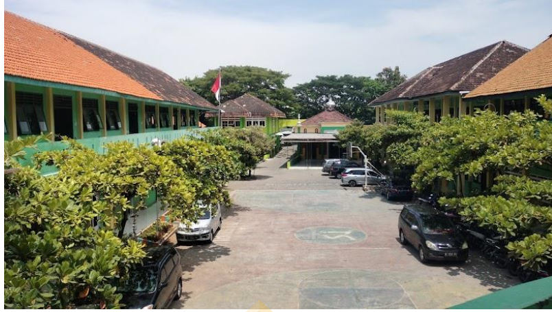
المدرسة المتوسطة الحكومية الاولى باسورون