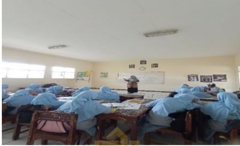
الملاحظة عملية التعليم وسيلة تخمين الصورة في فصل السابع المدرسة المتوسطة الحكومية الاولى باسورون