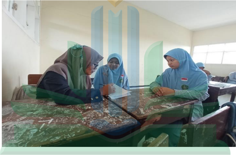
المقابلة اشخصية مع الطلاب في فصل السابع المدرسة المتوسطة الحكومية الاولى باسورون