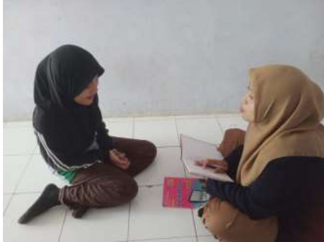
ربي اكفيلني, المقابلة الشخصية, ١٢ أغسطس ٢٠٢٣