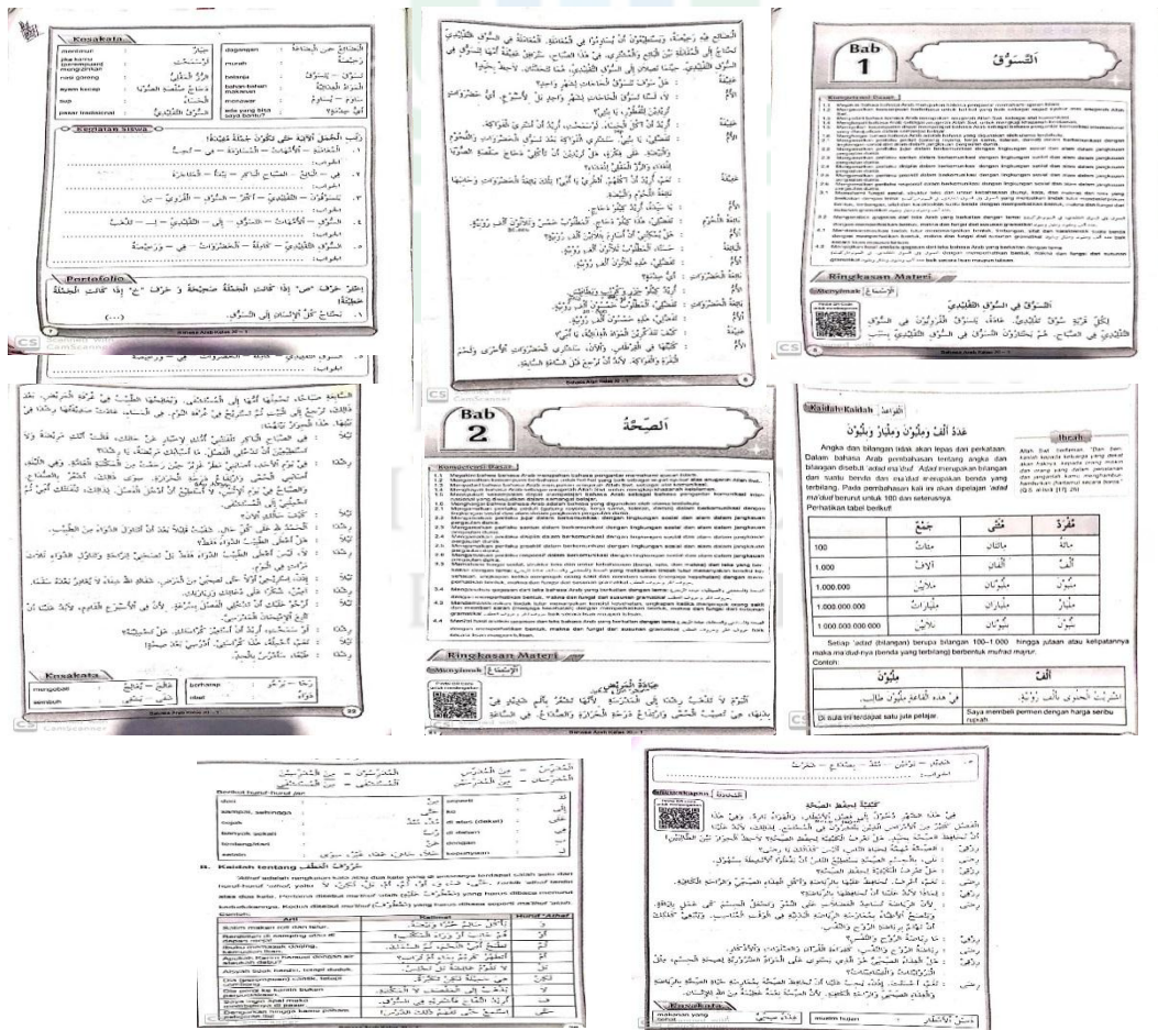
دلت الصورة المادة من المحورة في الفصل احدى عشر