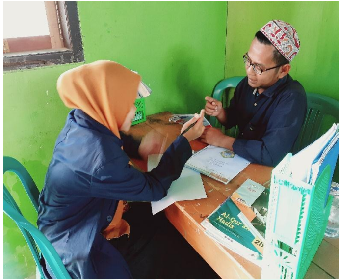
مقابلة الطالبة في المدرسة الثانوية الإسلامية دار الكرامة باسوروان