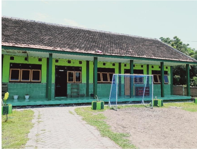
حالة الطبة في المدرسة الثانوية الإسلامية دار الكرامة باسوروان