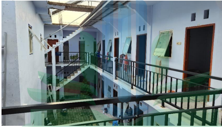
الملاحظة في معهد الحسنى الثاني للبنات