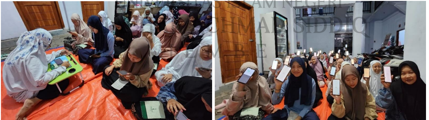
عملية التعليم باستخدام الاختبارات التفاعلية