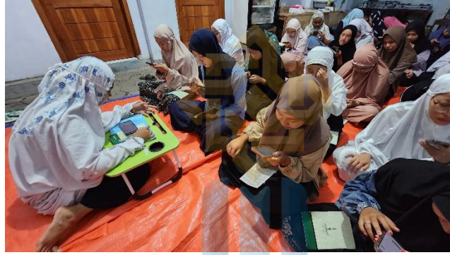
الصورة ١. ٤ عملية التعليم باستخدام الاختبارات التفاعلية

قالت المعلمة رزقي بنتي أنني أعلن على الطالبات في يوم الواحد قبل الاختبارات لتحمل الهواتف وإعداد الشبكة من المواد. وهذا الخبر لكي لا تشعر الطالبات بالدهشة لأن تنفيذ الاختبارات التفاعلية بعد الانتقال إلى مادة جديدة. أي إجراء الاختبارات عند الانتهاء بابين المتزوجين فقط كالتقييم لمادة التي تمت دراستها. ٤٤