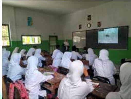
الصورة ١,٧. المناقشة المتعلقة بالمفردات جديدة