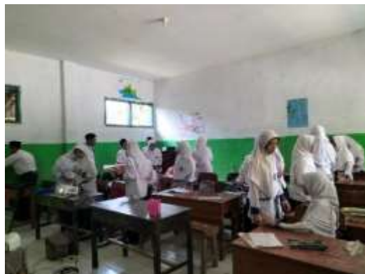
الصورة ١,٨. تشكيل المجموعة

بعد ذلك، قامت المعلمة بتقسيم الفصل إلى ٤ مجموعات تتكون من ٦-٧ طلاب للعب الاختبارات بمساعدة الوسائط Bamboozle . كما في الصورة أدناه: