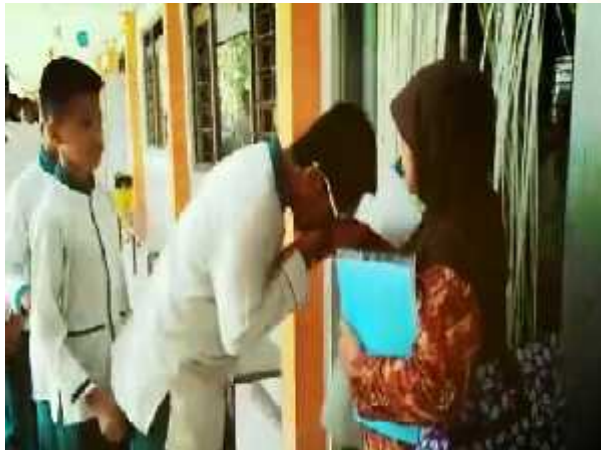
Adab terhadap guru