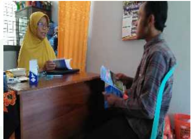
Wawancara guru akhlak