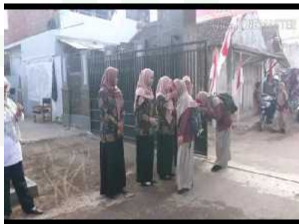
adab terhadap guru