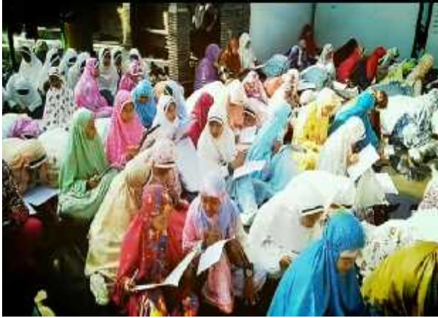
Pelaksanaan membaca waqi'ah siswi siswa