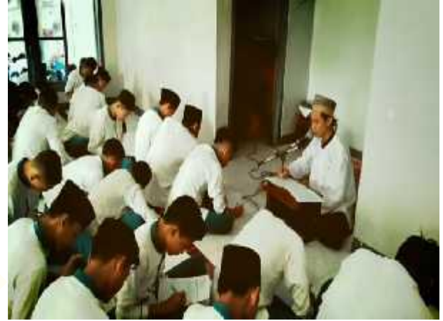
pelaksanaan membaca waqi'ah