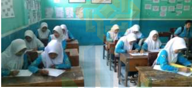
الصورة ١,٤ للاختبار البعدي باستخدام وسائط ريليا

وفي اللقاء الأخير تم إعطاء الطلاب اختبارا بعديا بهدف قياس النتائج النهائية التعلم إتقان المفردات باستراتيجية التعليم فرق الألعاب التعاونية باستخدام وسائط ريليا . كما في الصورة أدناه: