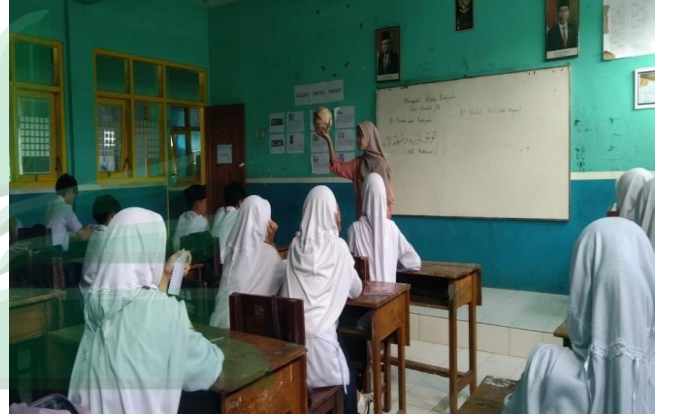
المناقشة المتعلقة المفردات باستخدام وسائط ريليا