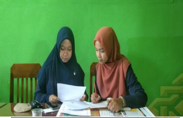
الملاحظة مع معلمة اللغة العربية في الفصل