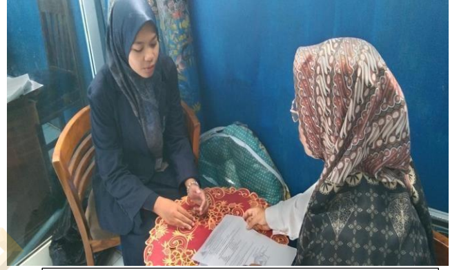
إذن للقيام بالبحث