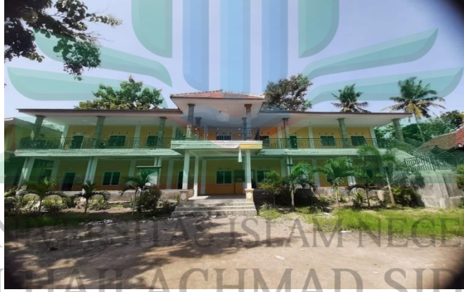
مدرسة المتوسطة نهضة العارفين

١. تاريخ تأسيس مدرسة المتوسطة نهضة العارفين