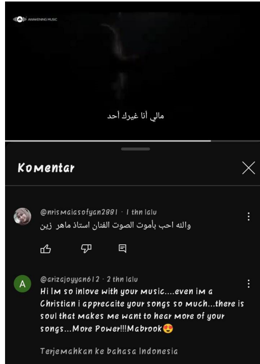
Gambar 2.1 Screenshot kolom komentar pada akun youtube Maher zain.

Hi Im so inlove with your music....even im a Christian i apprecaite your songs so much...there is soul that makes me want to hear more of your songs...More Power!!!Mabrook.