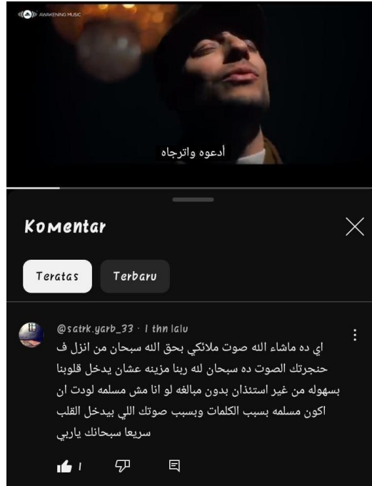
Gambar 2.1 Screenshot kolom komentar pada akun youtube Maher Zain.

اي ده ماشاء الله صوت ملائكي بحق الله سبحانه من انزل ف حنجرتك الصوت ده سبحانه لله ربنا مزينه عشان يدخل قلوبنا بسهولة من غير استئذان بدون مبالغه لو انا مش مسلمه لودت ان اكون مسلمه بسبب الكلمات وبسبب صوتك اللي بيدخل القلب سريعا سبحانك ياربي تتحدث عن جمال أغاني ماهر زين، صوته الجميل، والمعنى الذي يلامس القلب، والرسائل النبيلة التي تتضمنها.