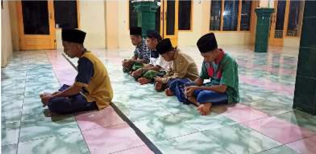
Dokumentasi santri yang baru menjalankan dalail al khairat