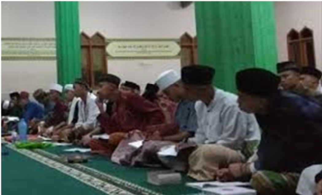
Evaluasi Ustad Dan Pengurus Pondok