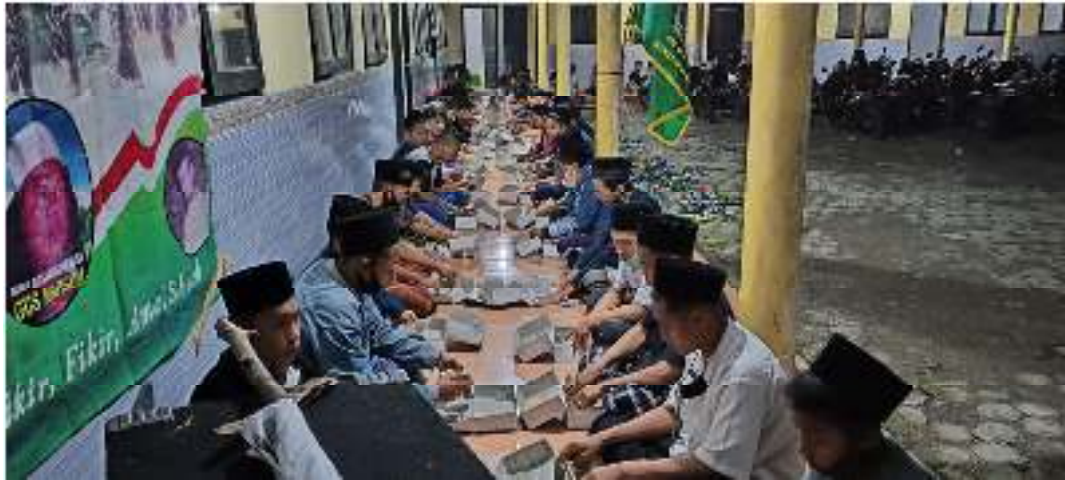
Silaturahmi sekaligus buka bersama di padepokan pagar nusa ababil