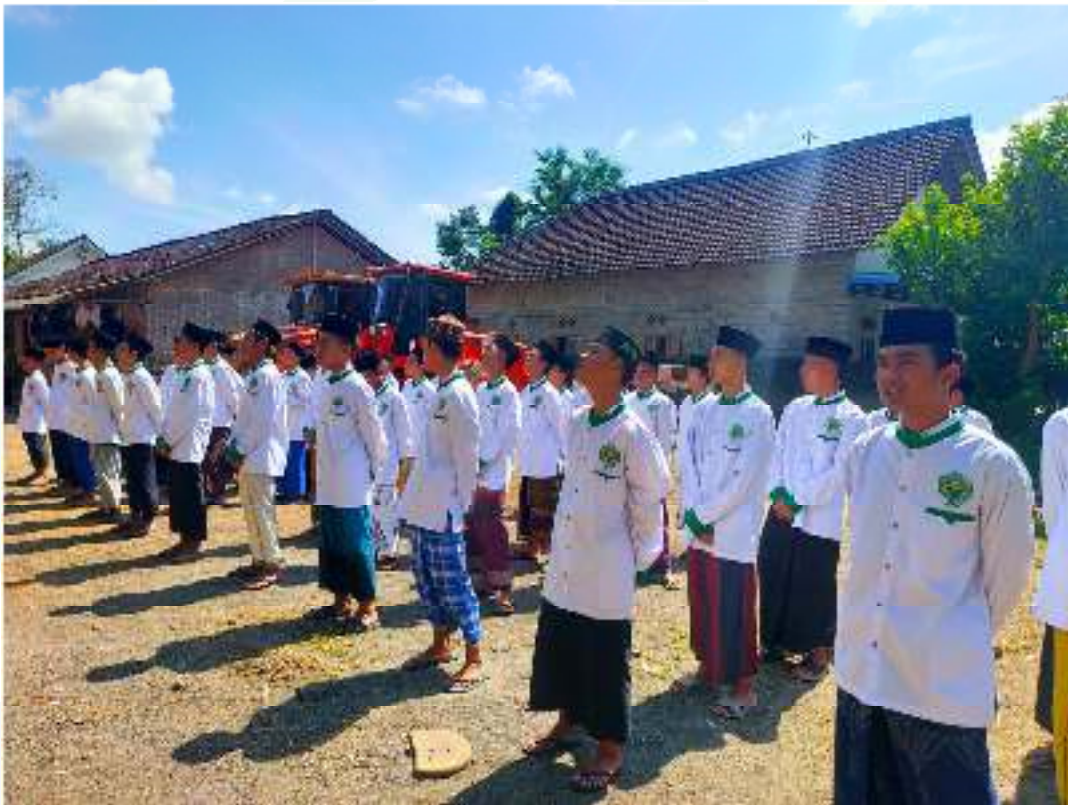
Apel pagi di halaman pondok