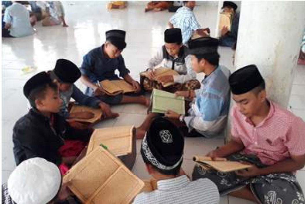
Prosesi ngaji kitab kuning di aula ponpes