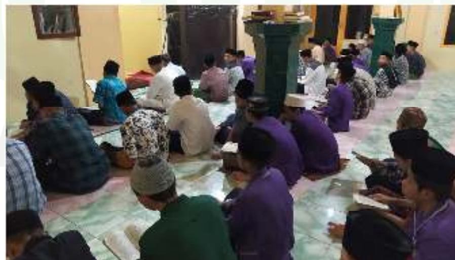
Proses Dalail Bersama