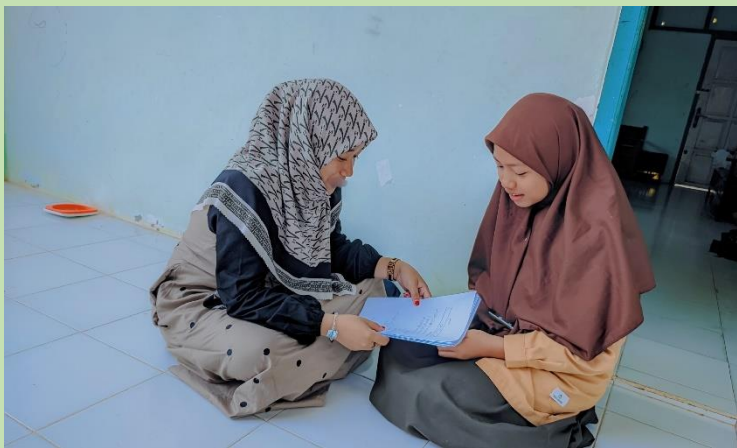
الملاحظة مع الطلبة صف السابع