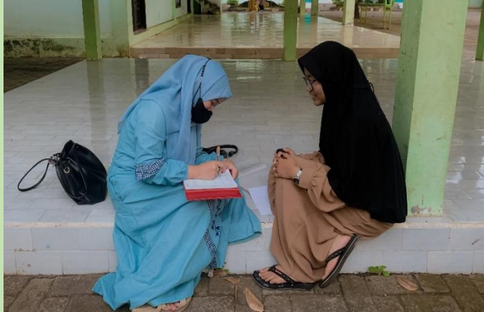
المقابلة مع معلمة اللغة العربية