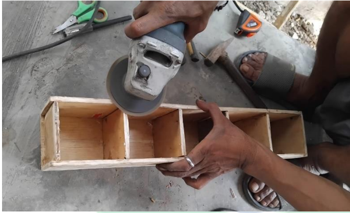
الصورة ٤ ٥: تصميم الصندوق الغامض

يعد الصندوق الغامض الموجود في هذه الوسائل أحد مكونات هذه اللعبة. يوجد في الصندوق الغامض أسئلة تدريبية مناسبة لمادة درس اللغة العربية. يحتوي تصميم الصندوق الغامض هذا على خمسة ألوان مختلفة لتناسب مع عجلة دوارة، حيث يحتوي كل لون على سؤال تدريبي مختلف. تصميم الصندوق الغامض على النحو التالي: