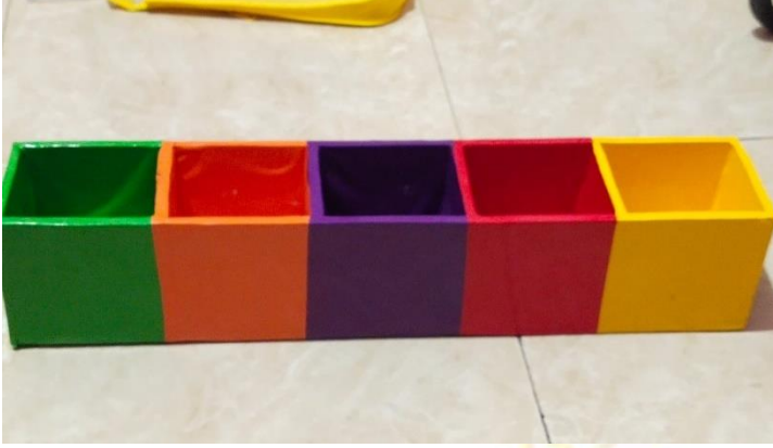
الصورة ٤ ٦: تصميم الصندوق الغامض

المرحلة الأولى من صنع الصندوق الغامض هي ترتيب الخشب الرقائقي الذي تم