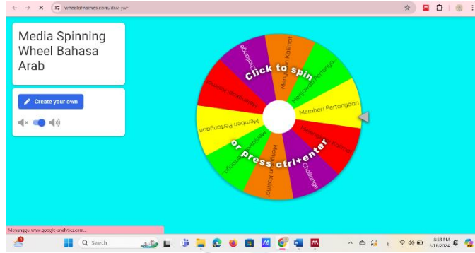
الصورة ١. ٢: تصميم وسيلة عجلة دوار