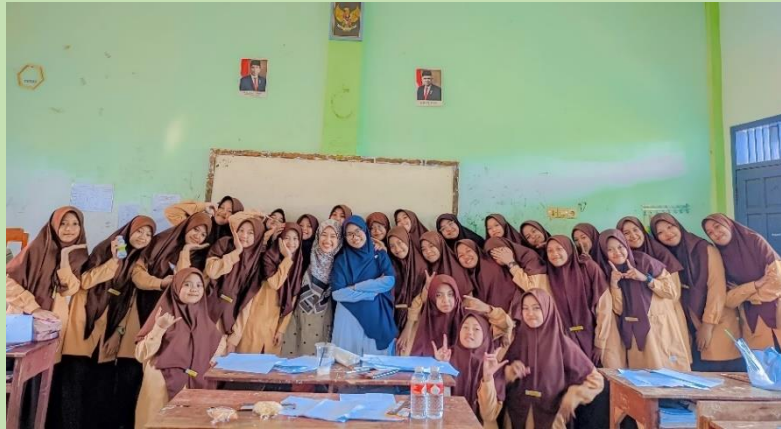
ثلاثون طالبة في الصف السابع