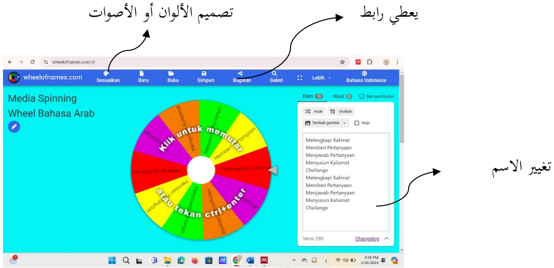
الصورة ٤. ٤: تصميم عجلة دوار

كيفية استخدام wheel of names سهلة للغاية دون الحاجة إلى التثبيت.