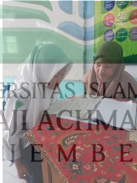
تقرأ الطالبة النصوص العربية