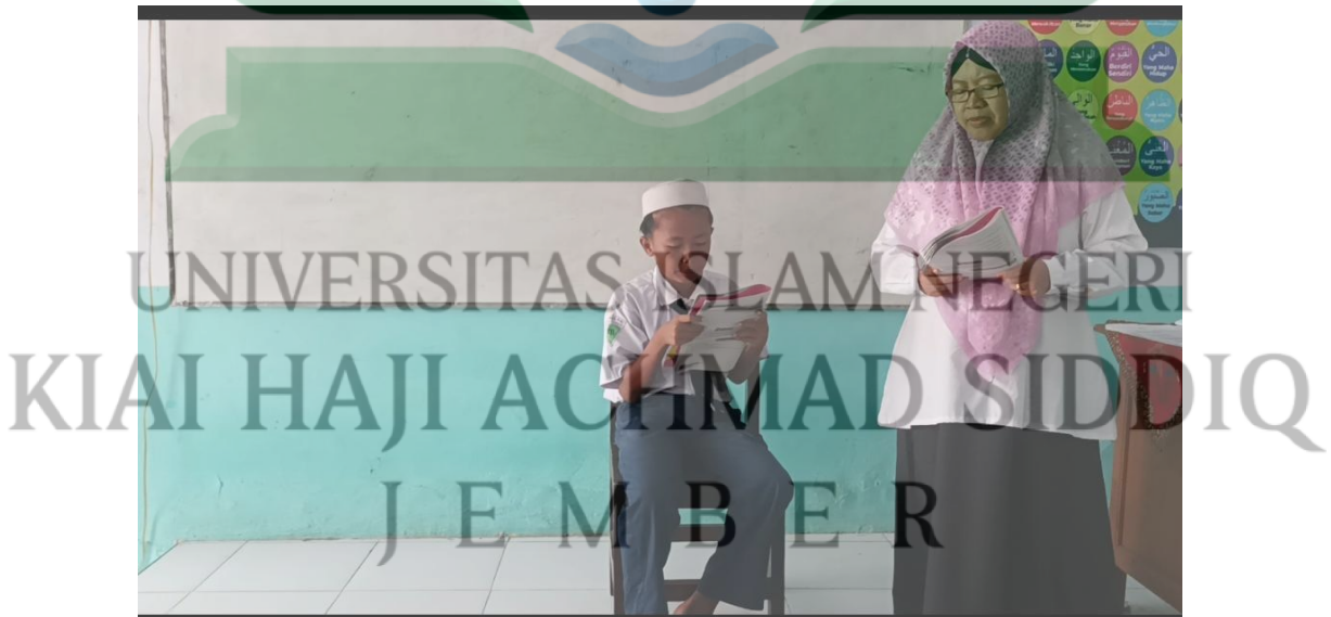
تعليم اللغة العربية في مهارة القراءة