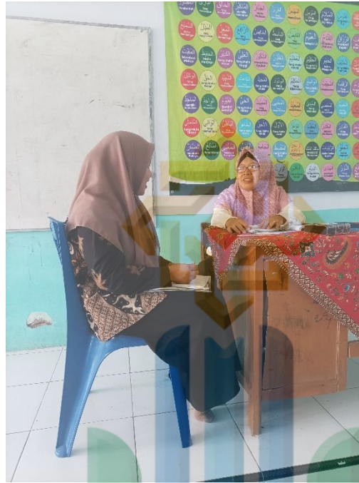
المقابلة الشخصية مع مدرسة اللغة العربية