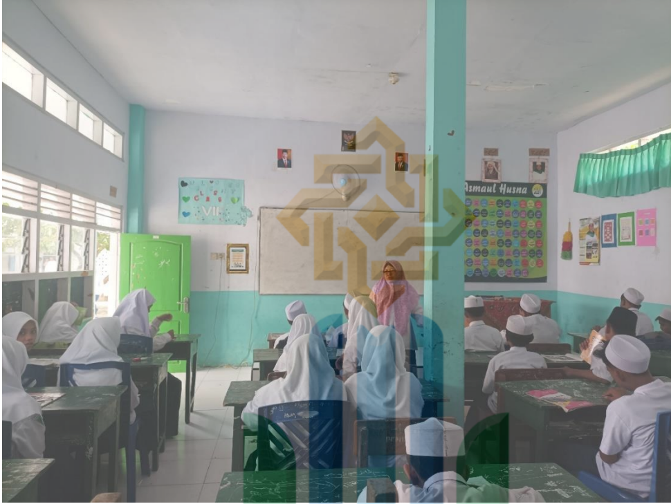
عملية تعليم اللغة العربية في الصف السابع بالمدرسة المتوسطة الإسلامية إحياء الإسلام