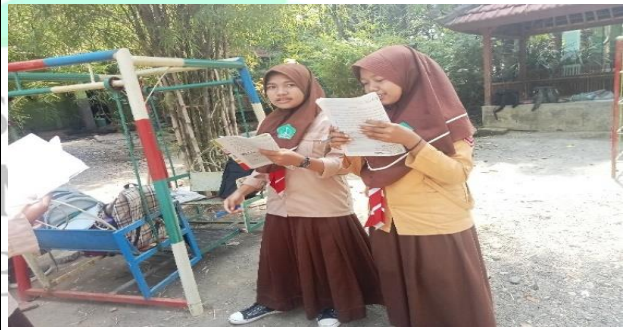
الصورة الطالبان في توصيل الاستنتاجات من المادة