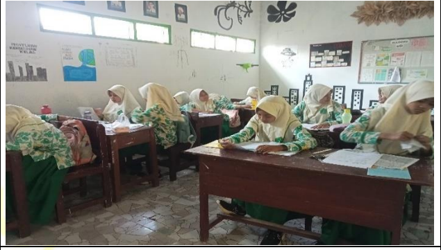
الإختبار القبلي للمجموعة التجريبية