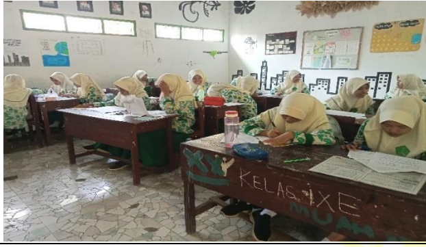
الإختبار البعدي للمجموعة التجريبية