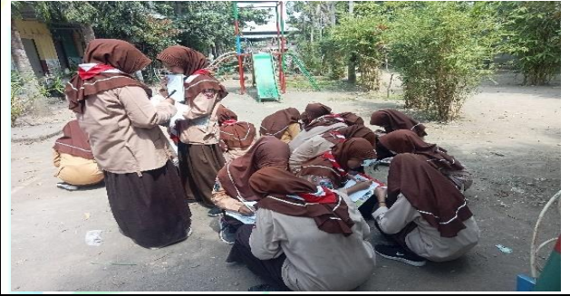
الصورة لتقسيم المجموعة في البحث عن المعلومات