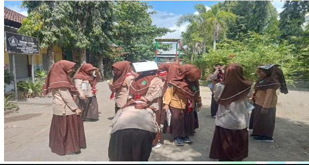
الصورة أنشطة نموذج التعليم (Inside Outside Circle)