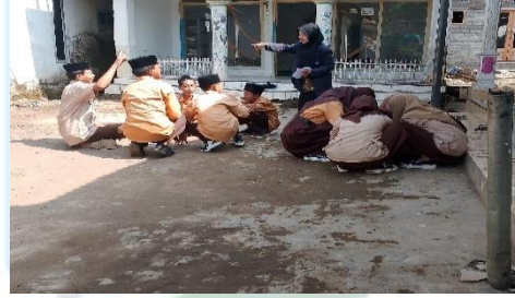
الجموعة التي تنتهي من بناء الجملة اولا

٢. فعالية طريقة التعليم الخارجي (Outbound) لترقية مهارة الكتابة في مدرسة نور الإسلام المتوسطة