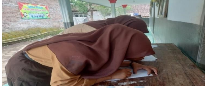
كتابة الجمل العربية التي تم اعدادها

اللقاء الثاني : تعليم مهارة الكتابة باستخدام طريقة التعليم الخارجي