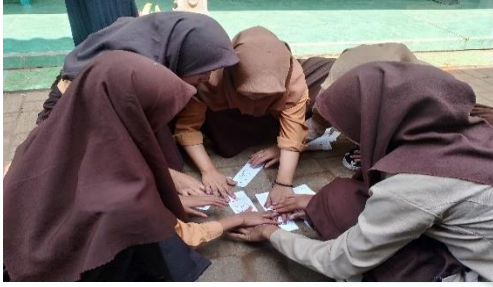
تكوين الجمل العربية