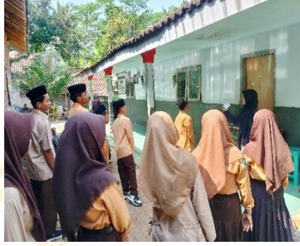
قل مفردات معا

و في اللقاء الثاني الأنشطة الأولية (التحية والدعاء والتحقق من الحضور). بعد ذلك،