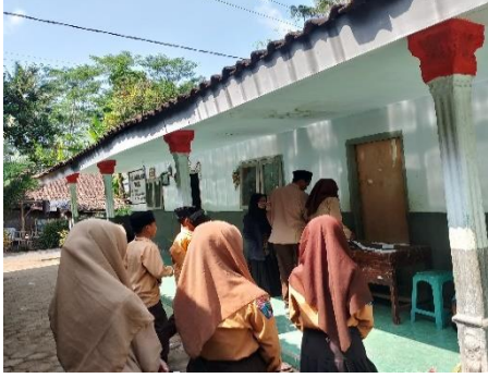
اختار المفردات المناسبة