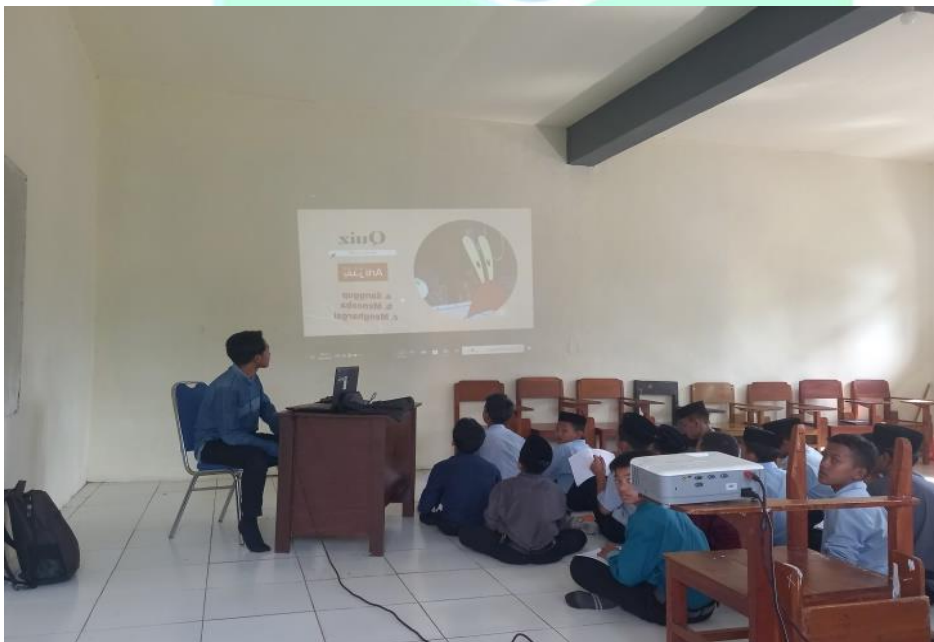
المقابلة الثالثة مع الطلاب الصف الثاني المجموعة التجريبية في تعليم مهارة الكتابة باستخدام الأفلام الكرتونية في يوم السبت ٢٦ أكتوبر ٢٠٢٤ م