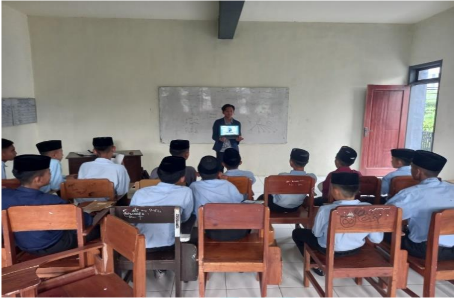
المقابلة الثانية مع الطلاب الصف الثاني المجموعة التجريبية في تعليم مهارة الكتابة باستخدام الأفلام الكرتونية في يوم الأربعاء ٢٣ أكتوبر ٢٠٢٤ م