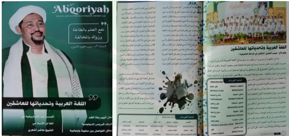
مجلة معهد رياض الصالحين الإسلام فروبولنجوا ٤٣

تظهر الصورة المذكورة مجلة عربية يصدرها معهد رياض الصالحين. تصدرها مرة واحدة في السنة و هي مصممة لتزويد الطلاب بفهم أعمق للنظريات العربية. بالإضافة إلى ذلك، تعمل المجلة أيضا كمصدر القراءة المفيدة لدى الطلاب، والذي يمكن أن يساعدهم على تحسين معرفتهم ومهاراتهم اللغة العربية. من خلال هذه المجلة، من المأمول