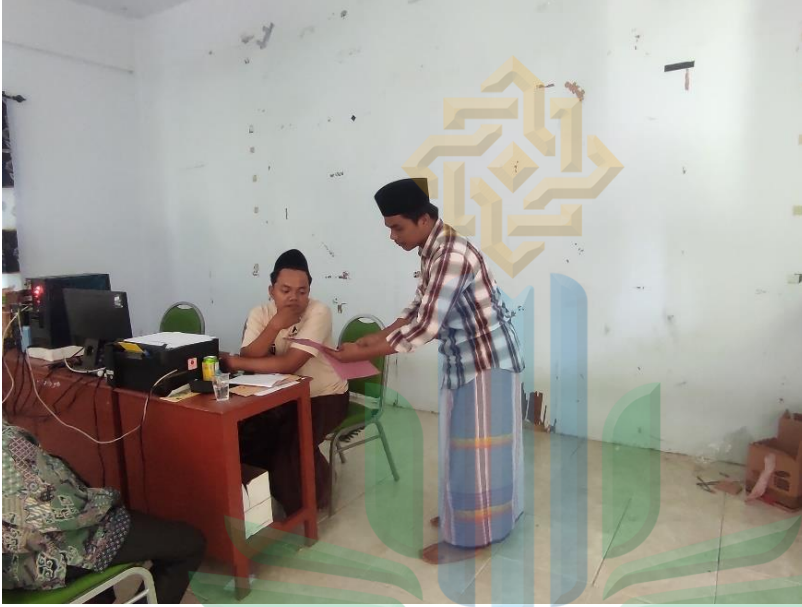
إعطاء رسالة البحث العلمي