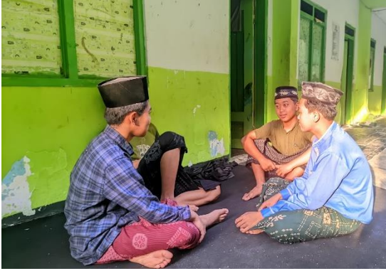
الأنشطة وجوب المكالمة باللغة العربية اليومية