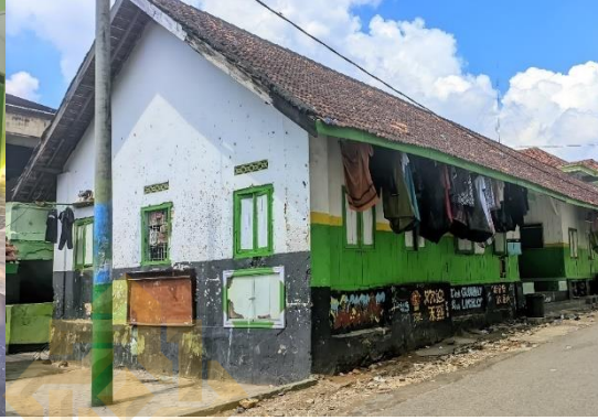
الملاحظة في هيئة تنمية اللغة الأجنبية قسم جمعية اللغة العربية