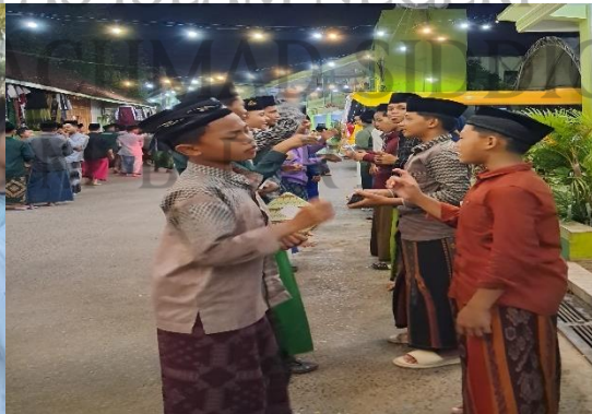
الأنشطة مناظرة الكبرى