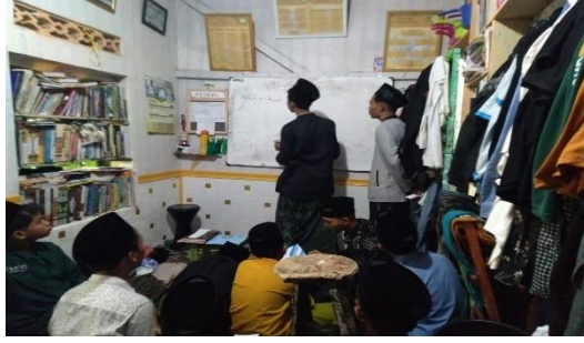
الصورة ٣, ٤ وصف الأشياء وتقديمها ٤٩