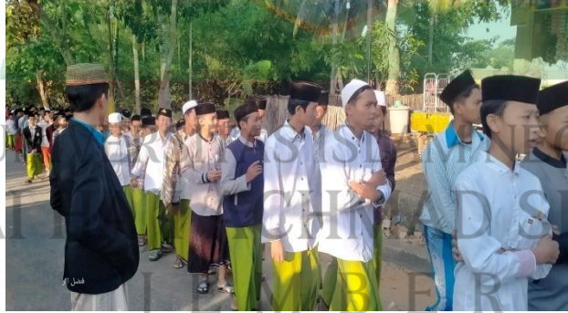
الصورة ٤,٤، الأنشطة جولة الأسبوعية ٥١

"نشاط الجواله هو نشاط روتيني أسبوعي يُنفذ في الصباح بنظام التجوال. يتم بالتعاون مع مركز اللغة العربية. معنى الجواله هو التجول، حيث يسير طلاب هيئة تنمية اللغات الأجنبية مع الطلاب مركز اللغة العربية في نزهة خفيفة أثناء التحدث باللغة العربية، ويتم ذلك بمثنى مثنى. في هذا النشاط، يُمنح الطلاب فرصة لتطبيق ما تعلموه طوال الأسبوع. يوفر هذا النشاط للطلاب فرصة للتحدث باللغة العربية مع شركائهم. في هذا النشاط، يتحدث الطلاب مع شريكهم حتى نهاية نقطة التوقف. بعد انتهاء هذا النشاط، يُقام نشاط التقديمات، الذي يتضمن عروضاً من الطلاب باللغة العربية. يهدف هذا النشاط إلى صقل مهارات الطلاب هيئة تنمية اللغات الأجنبية". ٥٠