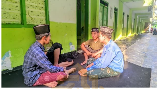
الصورة ١، ٤ وجوب المكالمة باللغة العربية اليومية ٤٥

فسوف يُعاقب. هذا النشاط جزء من جهودنا لخلق بيئة يكون فيها استخدام اللغة تجربة مباشرة للطلاب حتى يعتادوا على استخدام اللغة العربية". ٤٤