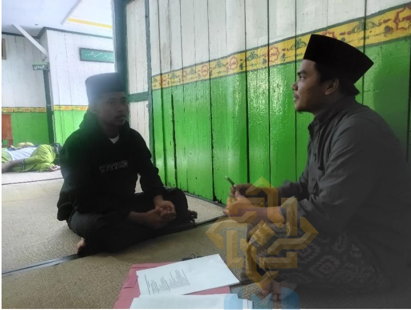
المقابلة الشخصية مع المعلم