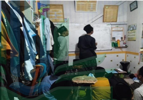
الأنشطة وصف الأشياء وتقديمها