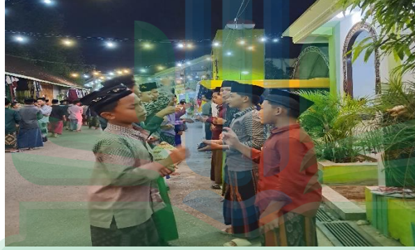
الصورة الأنشطة مناظرة الكبرى

الكلام تدعم بشكل تلقائي الكفاءة في المهارات الثلاث الأخرى. ولهذا السبب، يُطلب من كل غرفة تنفيذ أنشطة عملية تشجع الطلاب على المشاركة الفعالة في استخدام اللغة العربية. تشمل بعض الأنشطة العملية التي تُنفذ فيها الالتزام بالتحدث باللغة العربية يوميًا، بهدف تعزيز الطلاقة والفهم المباشر للغة. بالإضافة إلى ذلك، توجد أنشطة أسبوعية مثل المحادثات الدورية التي تتضمن نقاشات مع مختلف الأطراف لتعميق مهارة التحدث وتطوير القدرة على النقاش. كما تُعقد أنشطة شهرية مثل مناظرات كبرى لتدريب الطلاب على التحدث بشكل رسمي ومنظم، وكذلك لتطوير مهارات التفكير النقدي والقدرة على الجدل باللغة العربية. وتهدف جميع هذه الأنشطة إلى ضمان أن الطلاب لا يقتصرون على فهم النظريات فقط، بل يمكنهم أيضًا تطبيق اللغة في مواقف الحياة العملية اليومية. ٥٣