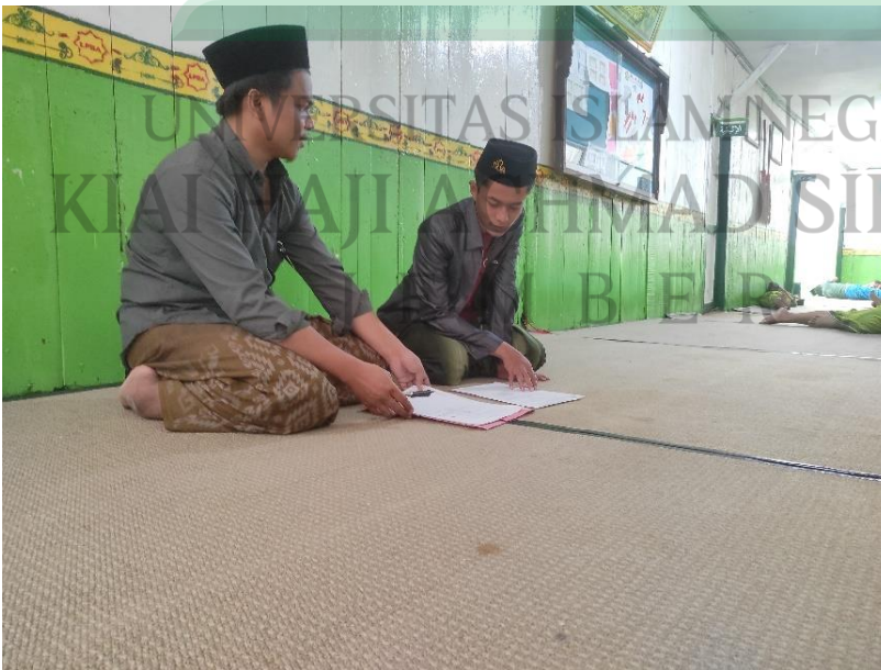
المقابلة الشخصية مع رئيس قسم جمعية العربية