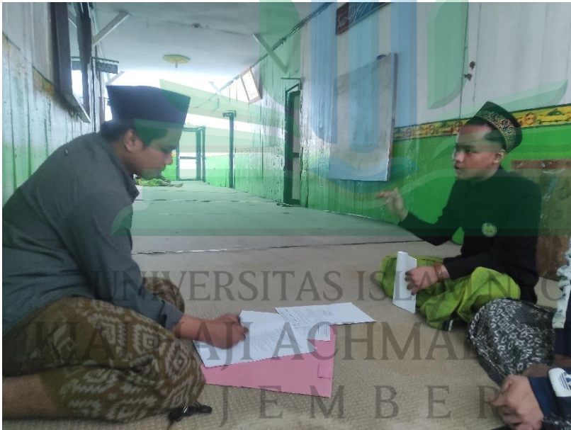
المقابلة الشخصية مع رئيس المعلم