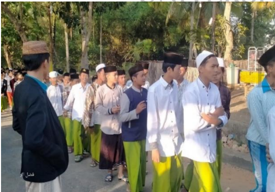
الأنشطة الجولة الأسبوعية