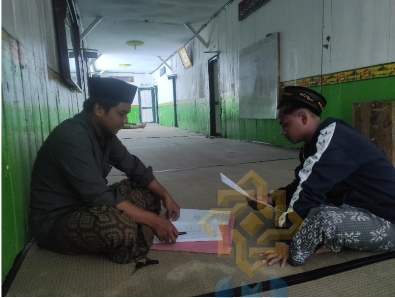
المقابلة الشخصية مع المعلم