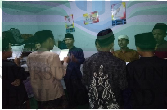
الصورة ٤,٢ الأنشطة المحادثة مع الزملاء باللغة العربية بعد تقديم المفردات ٤٧

"تبدأ المحادثة بتقديم المفردات أولاً بعد صلاة العشاء، ثم يُستكمل نشاط المحادثة حتى الساعة الثامنة، ثم هناك فترة استراحة قصيرة تليها جلسة التعليم، التي تبدأ من الساعة ٩:٣٠ حتى ١٠:٣٠. هذا النشاط جزء من الأنشطة الروتينية التي تُقام كل ليلة. وعادةً تُقام جلسات المحادثة أمام معهد تطوير اللغات الأجنبية إذا كان ذلك ممكناً." ٤٦