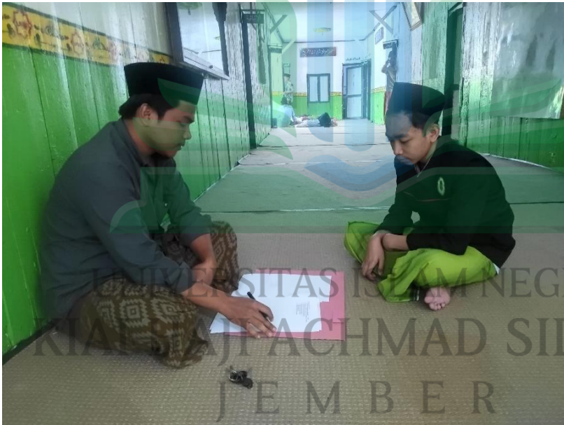
المقابلة الشخصية مع المعلم