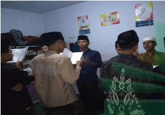
الأنشطة التحدث بالعربية بعد تقديم المفردات