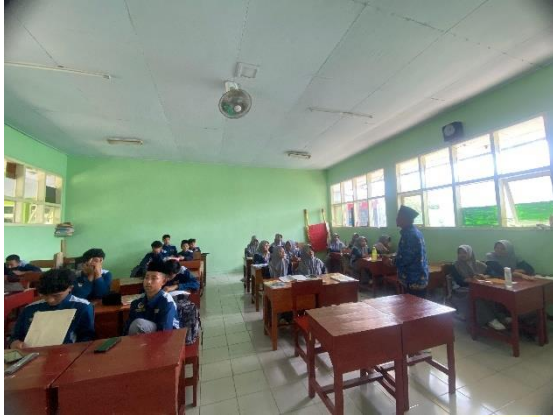
الاختبار القبلي للمجموعة التجريبية