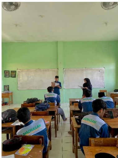
المقابلة للمجموعة التجريبية