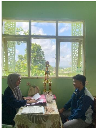
مقابلة شخصية مع طلاب الفصل العشرة B