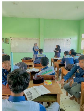
المقابلة للمجموعة الضابطة