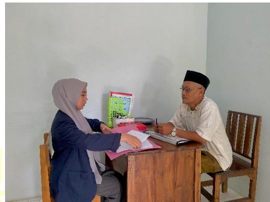
مقابلة شخصية مع مدرس اللغة العربية