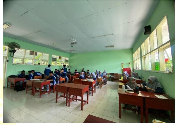
الاختبار القبلي للمجموعة الضابطة