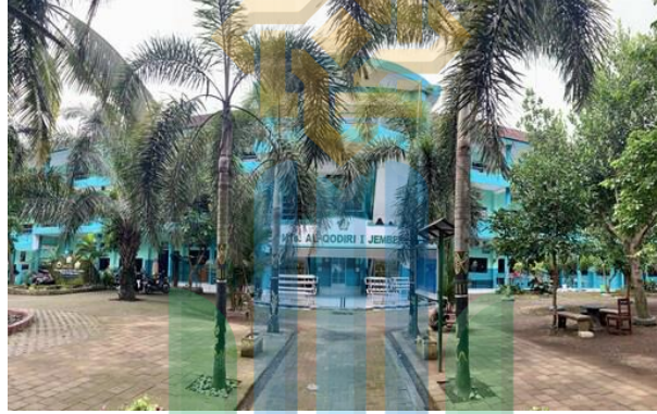
(مدرسة القادري المتوسطة الإسلامية المتفوقة ١ جمبر)