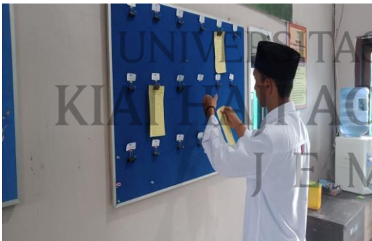
٦ . تحليل الطلاب المخالفين للغة العربية