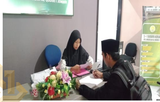
١ . مقابلة وإذن البحث