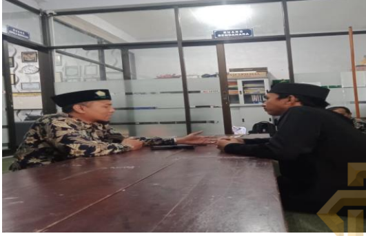
٢ . مقابلة مع المعلم حول منهج اللغة العربية