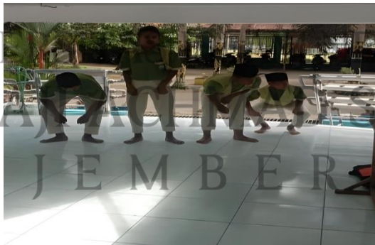
قائمة الصورة ٤.١٣

أما بالنسبة للعقوبة التي نقلتها الأستاذة خيرية والتي ذكرت أنه: ٨٥