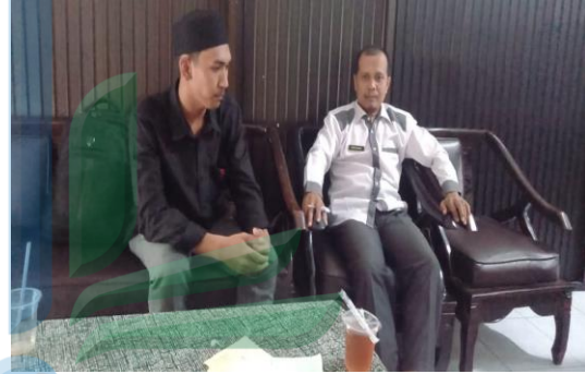
٣ . مقابلة مع الشخص المسؤول عن اللغة