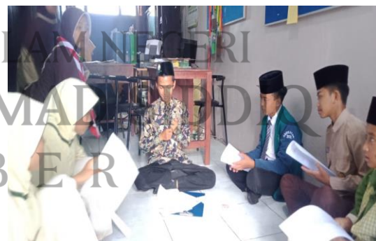
٥ . تقييم المخالفة الطلابية