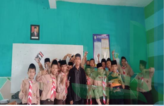
٤ . ملاحظة والمقابلة مع الطلاب